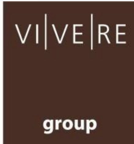
Gambar 2.1 Tabel Kegiatan Kerja Magang

VIVERE Group didirikan pada tahun 1984 sebagai kontraktor interior dengan kurang dari 10 karyawan dan berkembang menjadi salah satu pemain utama di industry interior dan furniture di Indonesia. Nama VIVERE berasal dari Bahasa Italia yang berarti to live, to be alive , mencerminkan filosofi Perusahaan untuk terus bertumbuh dan memberikan manfaat bagi lingkungan sekitar. Dalam empat dekade terakhir, VIVERE telah menjadi rumah bagi 5 perusahaan, 6 lini bisnis, 23 merek, dan lebih dari 1000 karyawan, menunjukkan komitmennya terhadap kualitas, inovasi, dan kepercayaan pelanggan.