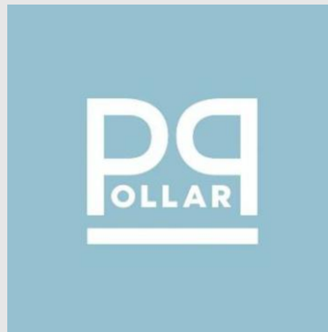
Gambar 2. 1 Logo PT. Pollar Jaya Abadi

PT. Pollar Jaya Abadi didirikan sejak awal tahun 2022, yang merupakan sebuah perusahaan penyedia jasa pemasaran secara digital untuk membantu para pemilik usaha dan bisnis di Indonesia yang mengutamakan pemecahan masalah, memberikan solusi serta mendorong usaha dan bisnis yang dimiliki oleh para pemilik di Indonesia pada berbagai macam platform media sosial.