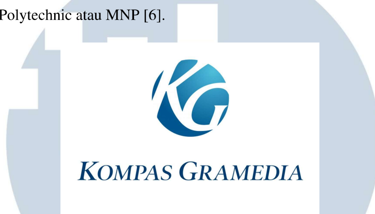
Gambar 2.1. Logo Kompas Gramedia

yang pada awalnya menggunakan kartu fisik KGVC (Kompas Gramedia Value Card). Aplikasi ini diperkenalkan pada tahun 2018 untuk mempermudah pelanggan dalam transaksi. Pada tahun 2021, Kompas Gramedia juga memperluas jaringan dengan mendirikan perguruan tinggi vokasi yang dikenal sebagai Multimedia Nusantara Polytechnic atau MNP [6].