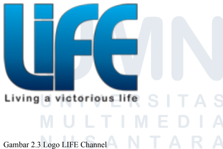
Gambar 2.3 Logo LIFE Channel

Dengan konsep One Stop Entertainment , MNC Channels berkomitmen untuk menjadi pilihan utama keluarga dalam menikmati tayangan televisi yang menghibur dan bermanfaat.