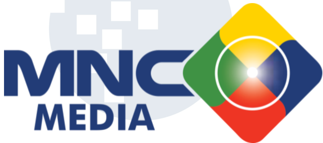
Gambar 2.1 Logo MNC Media

Pada tahun 1989 MNC Group berdiri. MNC Group berfokus pada empat strategi bisnis yaitu media & hiburan, jasa keuangan, hiburan perhotelan, dan energi. MNC Media, merupakan perusahaan media terbesar di Asia Tenggara yang berada di bawah naungan MNC Group.