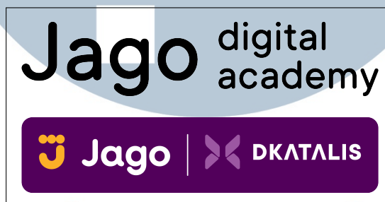
Gambar 2.4. Logo Jago Digital Academy

Pada 2021, PT Bank Jago Tbk meluncurkan Unit Usaha Syariah untuk melayani segmen pasar yang lebih luas dengan prinsip syariah, serta menjalin kerja sama dengan perusahaan investasi digital seperti Bibit. Di tahun 2022, PT Bank Jago Tbk merilis aplikasi Jago Syariah dan integrasi lebih lanjut dengan ekosistem GoTo melalui aplikasi GoBiz [1] [3].