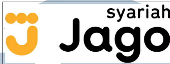
Gambar 2.3. Logo Jago Syariah

Jago Tbk juga menjalin kemitraan strategis dengan Gojek yang mencakup integrasi layanan pembayaran non-tunai melalui aplikasi Gojek [1] [3].