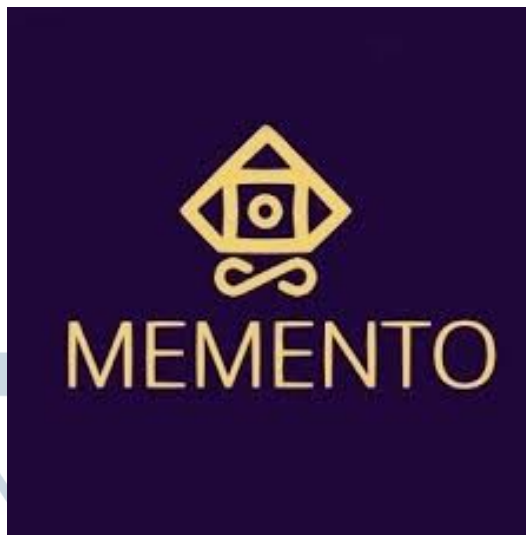
Gambar 2.1. Logo Memento Game Studio [1]

Memento Game Studio adalah sebuah studio pengembangan Game yang bergerak di bidang Game Indie [1]. Game Indie sendiri dapat didefinisikan sebagai game video yang dibuat oleh individu atau tim kecil tanpa dukungan finansial dan teknis dari penerbit game besar. Dalam pengerjaan suatu project Game, Memento Studio menggunakan berbagai game engine yang sesuai dengan project yang akan dibuat. Pengerjaan project juga didukung oleh beberapa Game Programmer serta Artist 2D maupun 3D yang menyediakan asset yang digunakan untuk project Game tersebut. Dalam suatu tim, akan ada Lead Production dari setiap bidang yang membantu dalam pengerjaan Project. Ada juga Music Composer yang akan melengkapi game tersebut dengan lagu yang cocok dengan suasana dari Game tersebut. Memento Studio juga bergerak dalam bidang Gamifikasi yang dapat membantu perusahaan untuk mempromosikan produk miliknya. Terbukti dari salah satu portofolio project Memento Studio yang menghasilkan sebuah video game Virtual Reality untuk mempromosikan sebuah brand cafe di Jakarta Barat