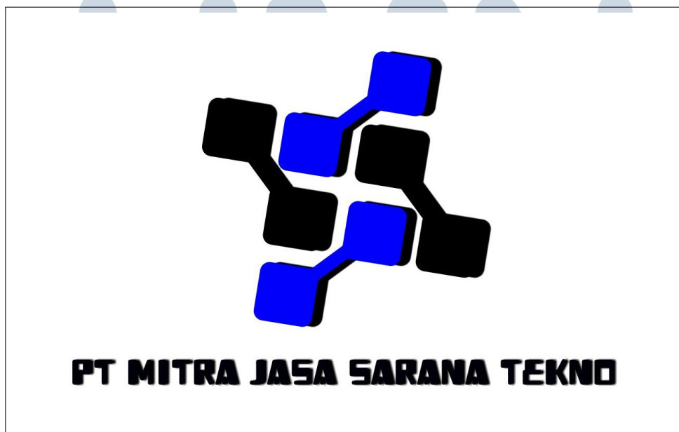
Gambar 2.1. Logo Perusahaan PT Mitra Jasa Sarana Teknologi

Logo PT Mitra Jasa Sarana Teknologi dapat dilihat pada Gambar 2.1.