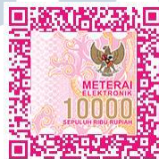
(Resnu Wilmar Wibisana)