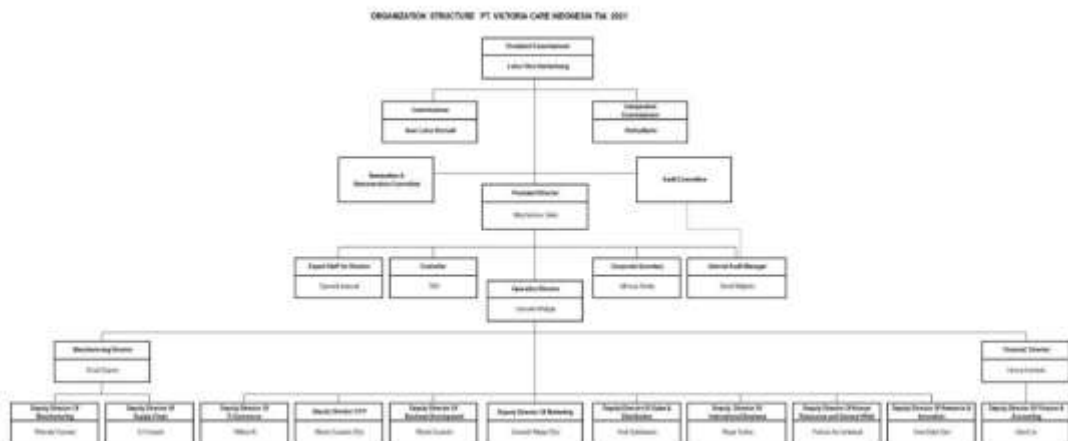
Gambar 2. 2 Struktur Organisasi