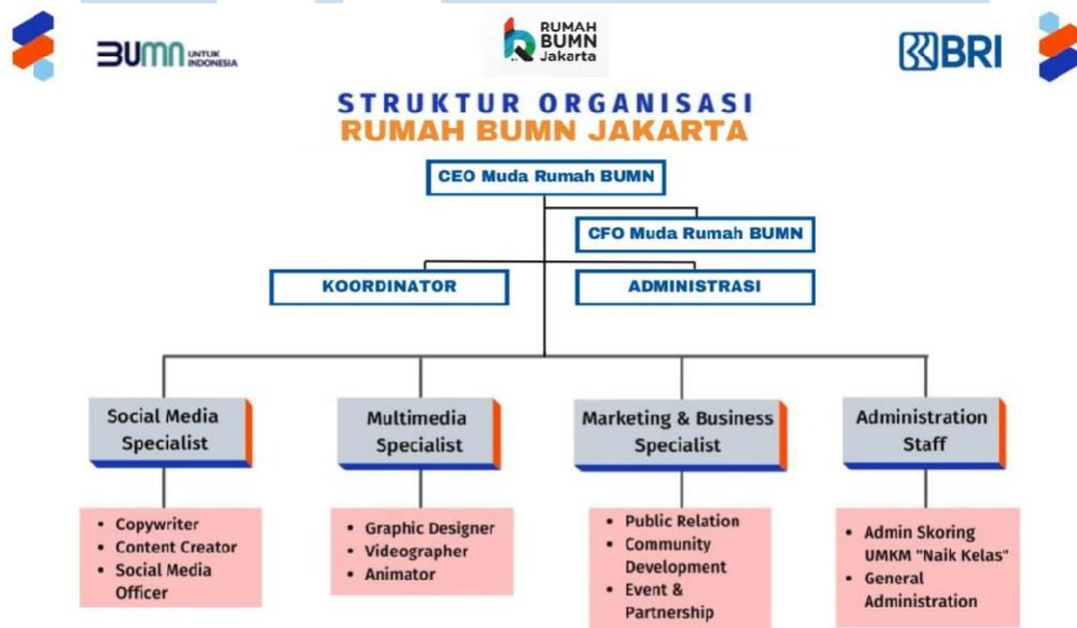
Gambar 2. 3 Struktur Organisasi Rumah BUMN Jakarta