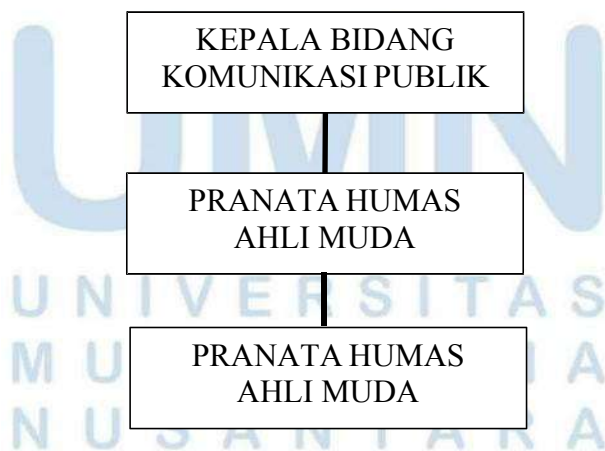
Tabel 2.2 Struktur Organisasi Bidang Komunikasi Publik

Bagan diatas adalah struktur organisasi dari Dinas Komunikasi dan Informasi lampung Selatan yang dipimpin oleh Kepala Dinas. Terdapat pembagian jabatan yaitu Kepala Dinas sebagai jabatan tertinggi yang bertugas untuk bertanggung jawab terhadap Dinas Komunikasi Lampung selatan lalu disusul oleh sekretaris yang