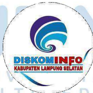
Gambar 2.1 Logo Dinas Komunikasi dan Digital Lampung Selatan (Diskominfo)

Logo Diskominfo Lampung Selatan memiliki makna sebagai berikut Secara menyeluruh bentuk logo ini terbentuk dari susunan tiga huruf C yang merupakan singkatan dari: Communication, Content and Computer , yang merupakan bidang utama tugas Departemen Komunikasi dan Informatika, Communication mengartikan bahwa Diskominfo harus melakukan komunikasi secara terbuka kepada