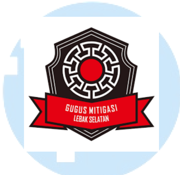
Gambar 2. 1 Logo Gugus Mitigasi Lebak Selatan

Komunitas Gugus Mitigasi Lebak Selatan atau yang kerap disingkat menjadi GMLS didirikan oleh warga Desa Panggarangan, Lebak Selatan, Banten. Sebagai inisiatif komunitas yang bertujuan membangun masyarakat Lebak Selatan yang waspada dan tahan bencana, GMLS bekerja di bidang mitigasi bencana, kesiapsiagaan, tanggap darurat, dan pemulihan darurat.