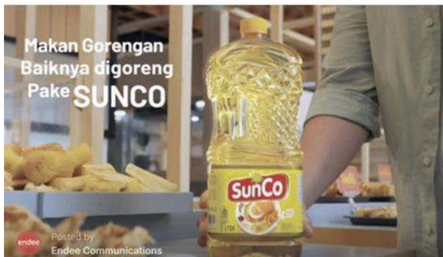
Gambar 2. 5

Sunco, dengan tagline "Sunco Minyak Goreng Baik", merupakan minyak goreng lokal yang menekankan kebersihan dan keunggulannya yang tidak mudah