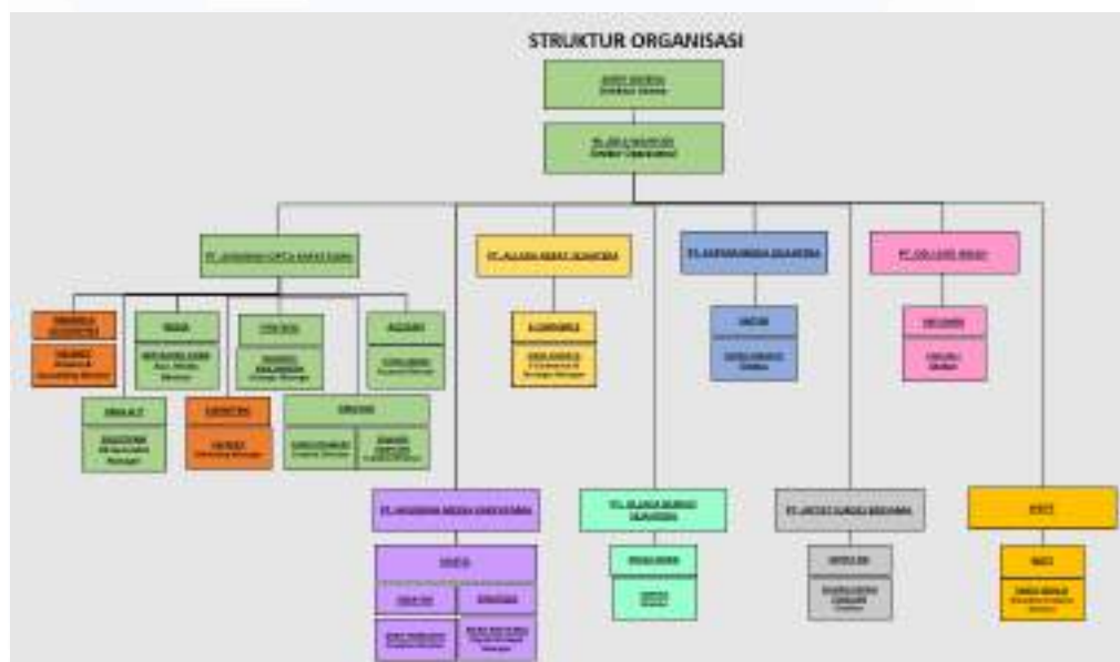
Gambar 2. 2 Bagan Endeecom 1

PT Anugrah Cipta Karyatama yang dipimpin oleh Andy Gusena, merupakan perusahaan yang memiliki sistem untuk mengklasifikasikan pekerjaan karyawan ke dalam beberapa bagian. Berikut adalah struktur organisasi Endee Communication: