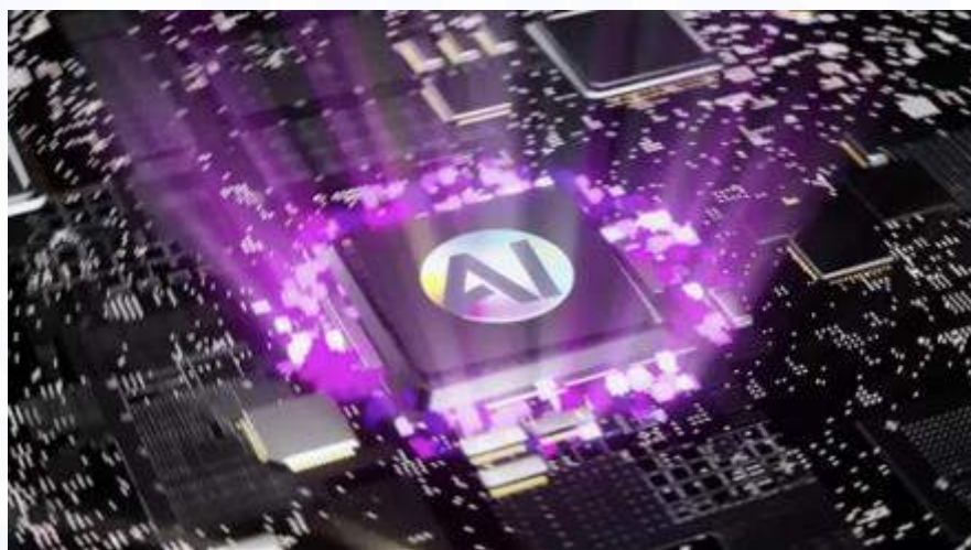
Gambar 2. 9