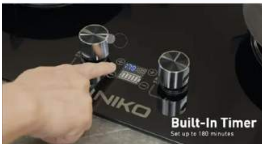
Gambar 2. 6

Produk Niko, dengan tagline "Niko! Kompor Kaca Dapur Mewah!", adalah kompor lokal yang menonjolkan kemewahan dan kecanggihan. Kampanye iklannya menggunakan TVC (televisi commercial) yang menampilkan keunggulan Kompor Niko Kitaro Black melalui testimoni dari Chef Arnold, yang disajikan dalam gaya visual cinematic. Dalam video tersebut, fitur-fitur utama seperti windshield yang mempercepat proses memasak, timer built-in untuk kemudahan, serta safety pin yang melindungi dari kebocoran gas saat memasak menjadi fokus utama. Dengan desain modern yang fungsional, kompor ini