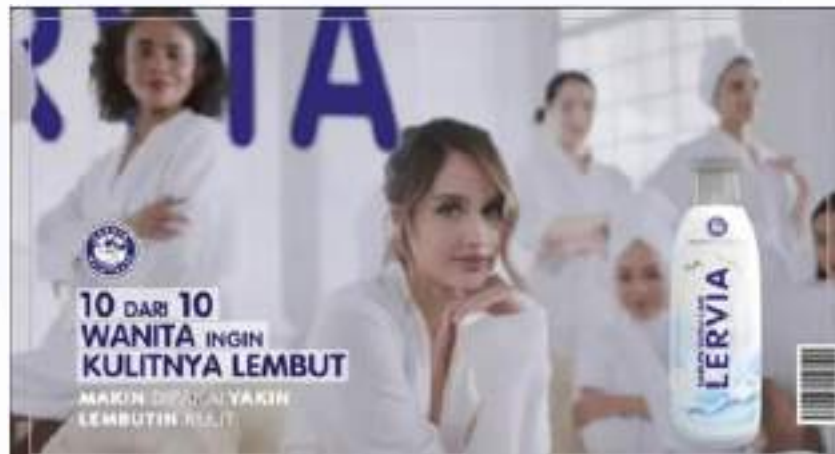
Gambar 2. 7

Kali ini, kampanye iklan yang digunakan Endeecomm juga merupakan TVC. Pada TVC ini, produk Lervia berkolaborasi dengan Cinta Laura dalam membuat TVC produk sabun susu ini menghadirkan pesan kuat tentang kelembutan kulit. Sabun susu Lervia diformulasikan dengan molekul partikel kecil yang cepat meresap ke dalam kulit, memberikan efek lembut bahkan sebelum dibilas. Dalam proses pembuatan iklan ini, 10 wanita cantik turut serta, menjadi ikon kecantikan yang mewakili impian setiap perempuan untuk memiliki kulit yang halus dan sehat.