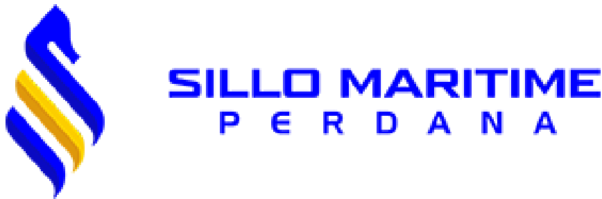
Gambar 2.1 Logo PT Sillo Maritime Perdana Tbk

PT Sillo Maritime Perdana Tbk adalah sebuah perusahaan jasa pelayaran yang berkantor di Jakarta Pusat. Perusahaan ini didirikan pada tahun 1989 oleh sebuah perusahaan publik yang bergerak di bidang jasa penyediaan kapal laut, yang berfokus pada pengelolaan kapal tanker (Sillomaritime Perdana: Sekilas Perseroan, n.d.).