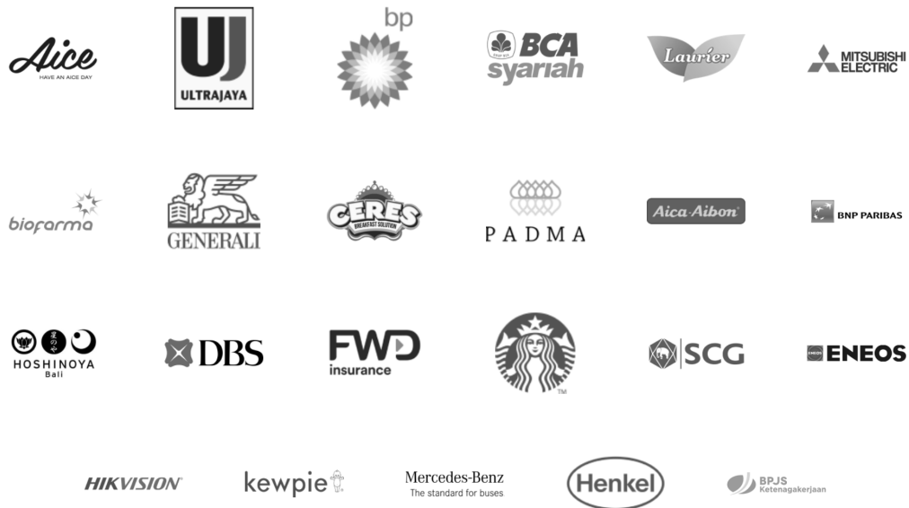
Gambar 2.3 Daftar Klien DGtraffic Indonesia

dapat dipahami bahwa agensi tersebut menekankan posisinya sebagai agensi yang relevan dan adaptif terhadap tren digital.