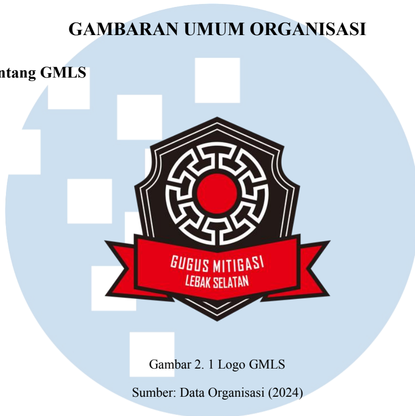
Gambar 2. 1 Logo GMLS