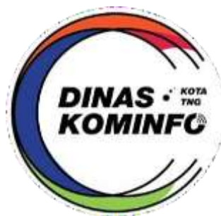
Gambar 2.1 Logo Diskominfo Kota Tangerang

Logo Dinas Kominfo Kota Tangerang terdiri dari tiga huruf C yang mewakili singkatan dari: Communication , Content , dan Computer , yang mencerminkan bidang utama tugas Dinas Kominfo Kota Tangerang. Warna-warna yang digunakan dalam logo ini merepresentasikan nilai-nilai dari Kota Tangerang, yaitu "LIVE" yang meliputi Liveable , Investable , Visitable , dan E-City .