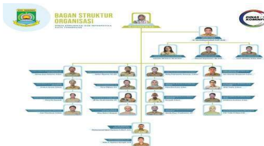
Gambar 2.2 Struktur Organisasi Dinas Komunikasi dan Informatika Kota Tangerang

Struktur organisasi merupakan sistem yang dirancang untuk menentukan hierarki dalam suatu organisasi, dengan tujuan mengatur operasionalnya serta mendukung pencapaian tujuan yang telah direncanakan. Struktur ini juga berfungsi sebagai gambaran visual yang merepresentasikan jenis organisasi tersebut, departemen, posisi, kewenangan pejabat, area dan hubungan pekerjaan, garis komando dan tanggung jawab, cakupan kendali, serta sistem kepemimpinan organisasi. Terdapat contoh dua struktur organisasi yang diberikan dalam konteks ini, yang menggambarkan komponen-komponen struktur organisasi untuk Dinas Komunikasi. (Haris S, 2006) (Veithzal Rivai, 2008) (dalam Nurlia Juni 2019, p.54). Struktur Organisasi Dinas Komunikasi dan Informatika Kota Tangerang