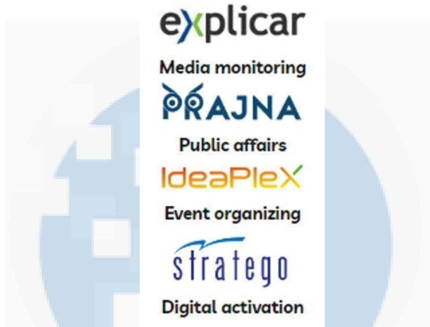
Gambar 2. 2 Logo Business Unit Praxis Public Relations

Layanan-layanan lengkap diatas ditawarkan oleh Praxis untuk membantu klien dalam menghadapi tantangan komunikasi yang kompleks. Adanya dukungan business unit seperti Explicar , Prajna , IdeaPlex , dan Stratego , Praxis memastikan setiap aspek dari kebutuhan klien terkelola secara efektif. Melalui pendekatan ini, Praxis telah bekerja sama dengan berbagai macam klien dari sektor yang berbeda-beda dan memberikan solusi yang sesuai dengan karakteristik industri masing-masing. Klien-klien tersebut yaitu: