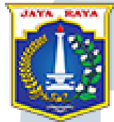
Gambar 2.1. Logo

Kantor Suku Dinas Komunikasi, Informasi dan Statistik Kota Administrasi Jakarta Pusat merupakan salah satu bagian dari kantor unit pelaksana teknis di bawah Dinas Komunikasi, Informatika, dan Statistik Provinsi DKI Jakarta. Memiliki kedudukan yang sejajar dengan Kantor Suku Dinas Komunikasi, Informasi, dan Statistik di kota administrasi wilayah Jakarta Timur, Kantor Suku Dinas Komunikasi, Informasi, dan Statistik di kota administrasi wilayah Jakarta Barat, Kantor Suku Dinas Komunikasi, Informasi, dan Statistik di kota administrasi wilayah Jakarta Utara, Kantor Suku Dinas Komunikasi, Informasi, dan Statistik di kota administrasi wilayah Jakarta Selatan. Kantor - kantor tersebut Memiliki tanggung jawab atas pelaksanaan urusan pemerintahan di bidang komunikasi dan informatika, statistik, serta persandian alias IT di wilayah kota masing-masing. Pembentukan ini bertujuan untuk mengatur sistem tata kerja IT dan mengatur sistem jaringan di setiap pemerintahan kota administrasinya.