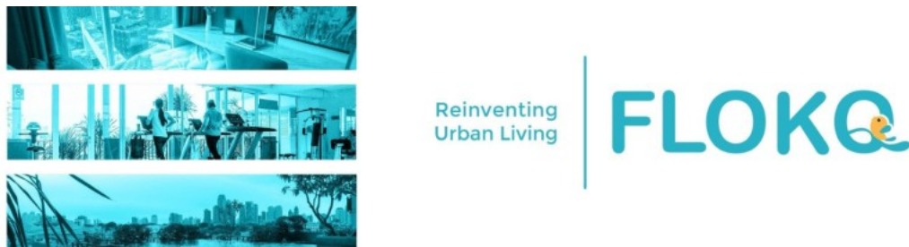
Gambar 2.2 Banner Perusahaan PT. Flokq Spaces

Di bawah kepemimpinan para pendirinya, Flokq kini menjadi salah satu platform terkemuka di Asia Tenggara. Selain menyediakan layanan penyewaan, Flokq juga menawarkan pengelolaan properti yang mencakup berbagai aspek, seperti perawatan, keamanan, hingga layanan tambahan yang dirancang untuk meningkatkan kenyamanan penghuni.