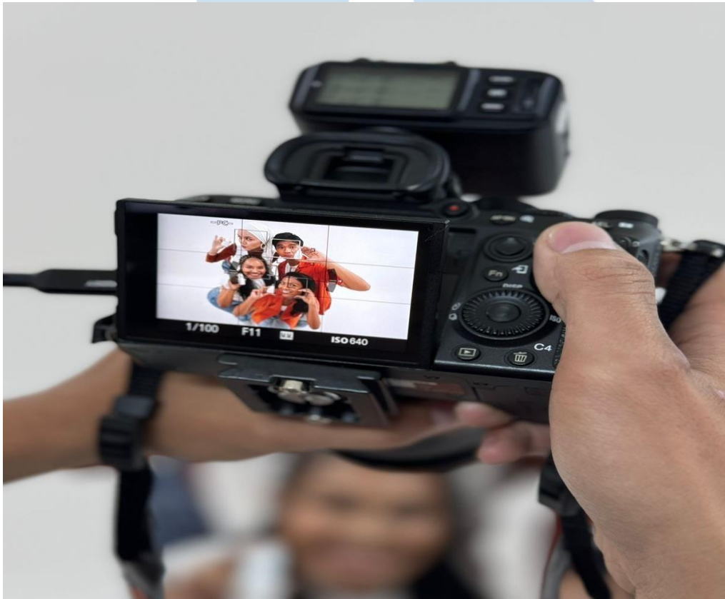
Gambar 3.7 Photoshoot product

Tidak hanya mengikuti event membuka booth seperti gambar-gambar diatas, penulis juga mengikuti photoshoot untuk brosur dan kepentingan foto produk dari NMW sendiri.