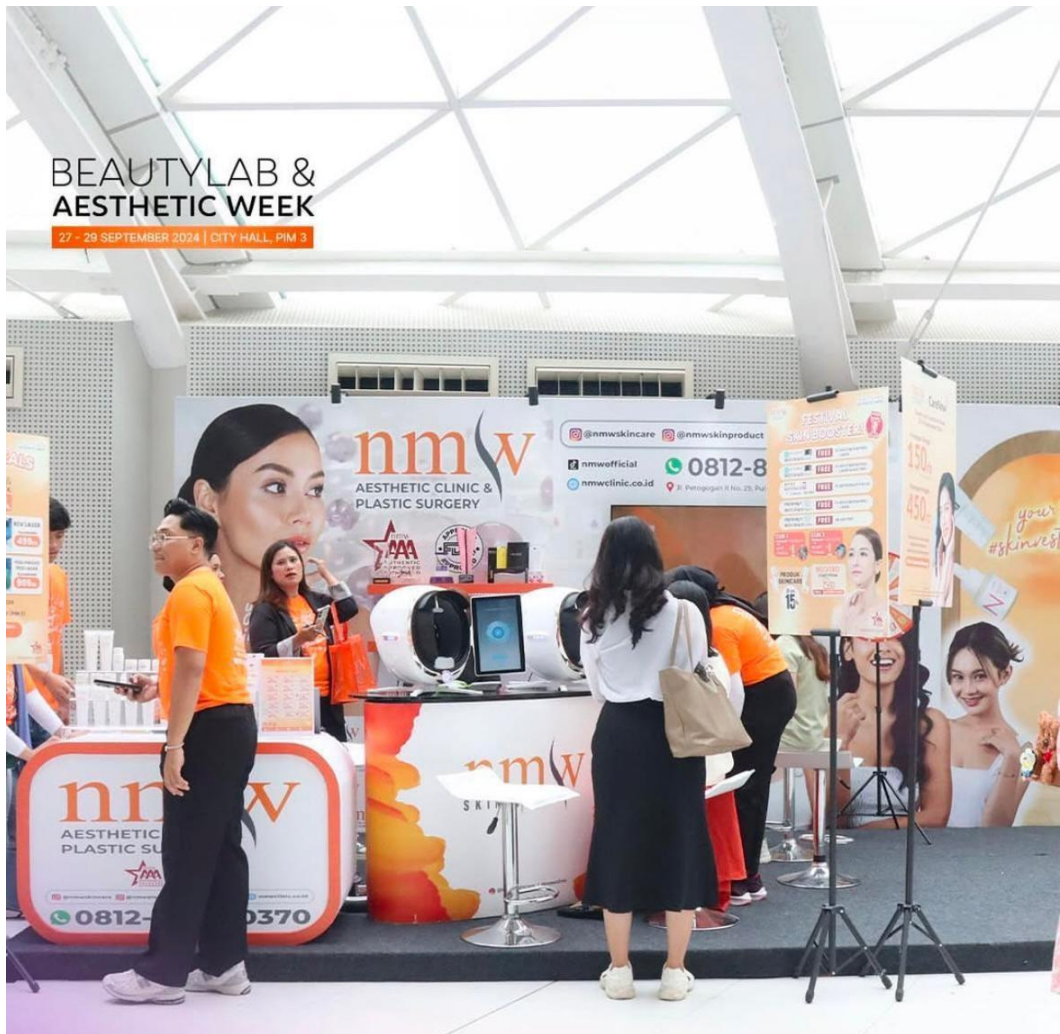
Gambar 3.4 pada acara di Pondok Indah Mall