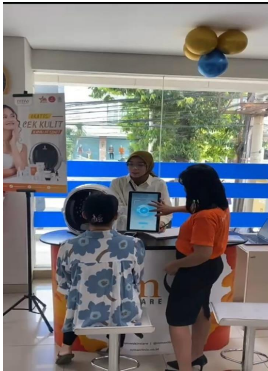
Gambar 3.2 Pengambilan video saat event

Contoh sedikit saat penulis mengambil konten untuk kepentingan sosial media NMW yang di upload pada sosial media NMW. Tidak hanya pengambilan video saja penulis membuat script untuk pengambilan video untuk konten yang berkolaborasi antara NMW Clinic dan Rumah sakit brawijaya, dengan tujuan memberikan informasi tentang hasil dari treatment , efek dari treatment .