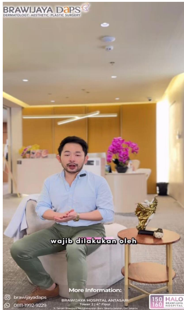
Gambar 3.3 Contoh skript dan video yang dibuat