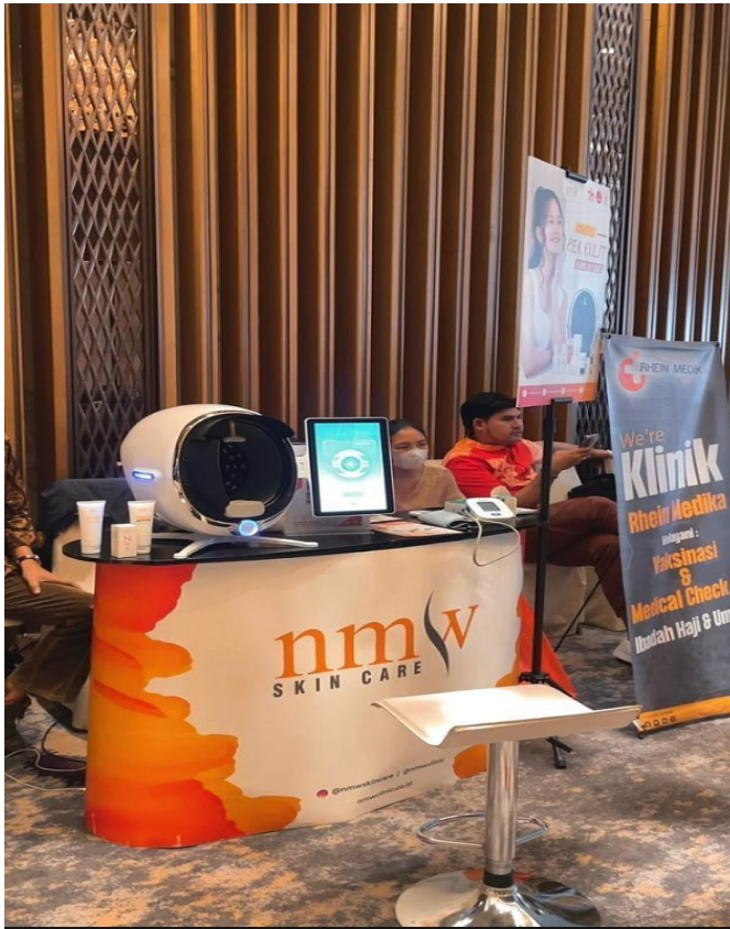
Gambar 3.6 Event di Hotel Westin

Kemudian tidak hanya itu masi banyak banyak event yang diikuti oleh penulis seperti satu contoh lagi event di hotel Westin yang dimana, NMW berkolaborasi dengan travel agent Umroh bernamakan hanania