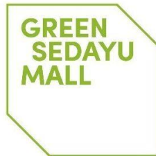
Gambar 2.1 Logo Green Sedayu Mall

Green Sedayu Mall, anak perusahaan Agung Sedayu Grup, terletak di kawasan seluas 2,2 ha yang strategis di Jakarta Barat. Mall ini memiliki dua menara apartemen, Tower Pasadena dan Tower New York, serta Hotel Hilton Garden Inn. Grand Opening Green Sedayu Mall sukses dilaksanakan pada 31 Juli 2020 dengan dukungan dari tenant terbaik. Kami hadir untuk menyediakan Kuliner dan Lifestyle guna memenuhi kebutuhan seluruh pelanggan, dengan 70% tenant Makanan dan Minuman ternama seperti Ta Wan, Mutiara Chinese Food, Thai Street, Imperial Kitchen & Dimsum, Gokana Ramen & Teppan, Tom Sushi, Dapur Solo, KOI, Starbucks dan masih banyak lagi tenant lainnya. Green Sedayu Mall memiliki supermarket Farmers Market di Lantai Dasar dan XXI di Lantai 2 untuk para pecinta film. Di lantai yang sama, terdapat juga Amazon, Anytime Fitness, dan Miniso. Di lantai 1 terdapat pula Uniqlo.