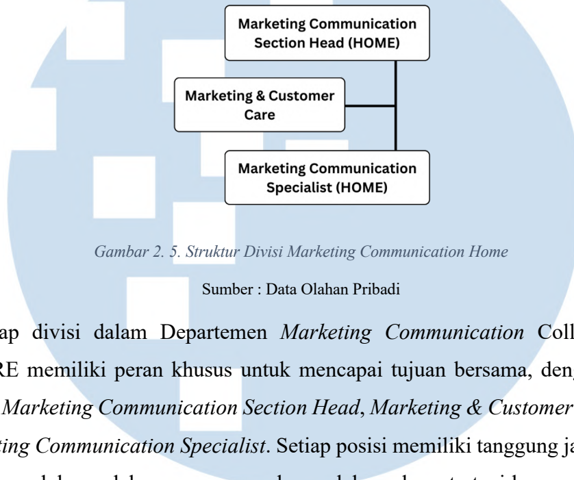
Gambar 2. 5. Struktur Divisi Marketing Communication Home

marketing . Divisi Marketing Communication Collection By VIVERE terdiri Marketing Communication Section Head , Marketing & Customer Care , dan Marketing Communication Specialist .