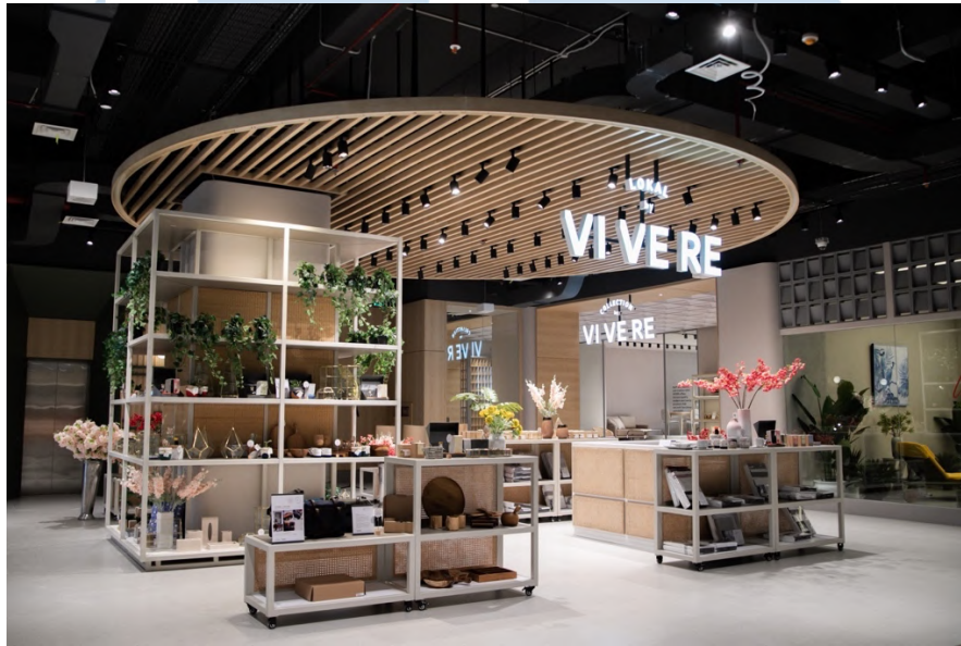
Gambar 2. 3 Showroom Collection by VIVERE di South 78

craft ), makanan dan minuman, peralatan makan, dekorasi rumah, hingga fashion bernama #VIVERElokal, kolaborasi ini bertujuan untuk mendukung kreativitas dan kualitas produk lokal agar dapat bersaing secara global, serta menghadirkan nilai-nilai yang sejalan dengan standar internasional.