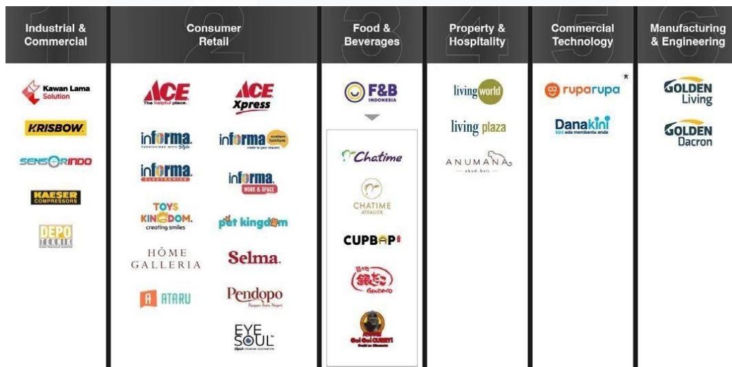
Gambar 2.1.2 Ekspansi Perusahaan PT Kawan Lama Sejahtera

Dengan filosofi "Supporting Your Business", Kawan Lama berkomitmen untuk membantu berbagai sektor bisnis dengan menyediakan berbagai produk berkualitas tinggi, menyediakan layanan yang baik, dan solusi yang inovatif. Saat ini, PT Kawan Lama Group (Sejahtera) bergerak sebagai perusahaan dengan enam pilar bisnis. Enam Pilar bisnis ini meliputi Industrial & Commercial, Consumer Retail, Food & Beverage, Property & Hospitality, Commercial Technology, serta Manufacturing & Engineering. Bersama dengan lebih dari 5.000 karyawan dan berbagai brand terkemuka, Kawan Lama Group berfokus pada keberlanjutan, inovasi, dan juga kualitas yang telah menjadi fondasi dari setiap basis pilar bisnisnya. Hal ini menjadikan Kawan Lama lebih dari sekedar penyedia produk dan layanan, tapi juga sebagai mitra strategis dalam industri.