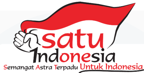
Gambar 2.3. Logo SATU Indonesia Astra