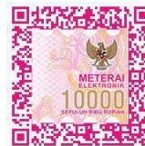
(Muhammad Afiq Walid)