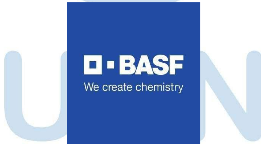
Gambar 2.1 Logo BASF

BASF telah beroperasi di Indonesia selama lebih dari 48 tahun. Perusahaan ini memulai investasinya di negara ini pada tahun 1976 dan memulai produksi komersial pada tahun 1977. Portofolio BASF terbagi dalam enam segmen: Bahan Kimia, Material, Solusi Industri, Teknologi Permukaan, Nutrisi & Perawatan, dan Solusi Pertanian. Saat ini, solusi BASF berkontribusi pada kesuksesan pelanggannya di Indonesia di hampir semua industri, termasuk pertanian, makanan, perawatan rumah & pribadi, otomotif, cat dan pelapis, serta bahan kimia. Kantor pusat BASF di Indonesia berlokasi di Jakarta, dengan lokasi produksi di Cengkareng, Cimanggis dan Merak. Pada tahun 2023, BASF mencatat penjualan sekitar €495 juta Euro untuk pelanggan di Indonesia dan mempekerjakan 477 karyawan hingga akhir tahun tersebut.