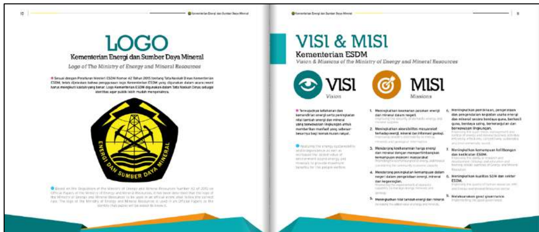
Gambar 3. 1 Company Profile Kemeterian ESDM oleh PT Integra Cipta Kreasi