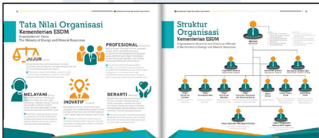
Gambar 3. 2 Company Profile Kemeterian ESDM oleh PT Integra Cipta Kreasi