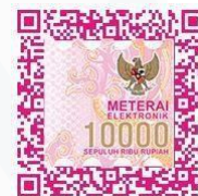
Gilang Al Ghifari