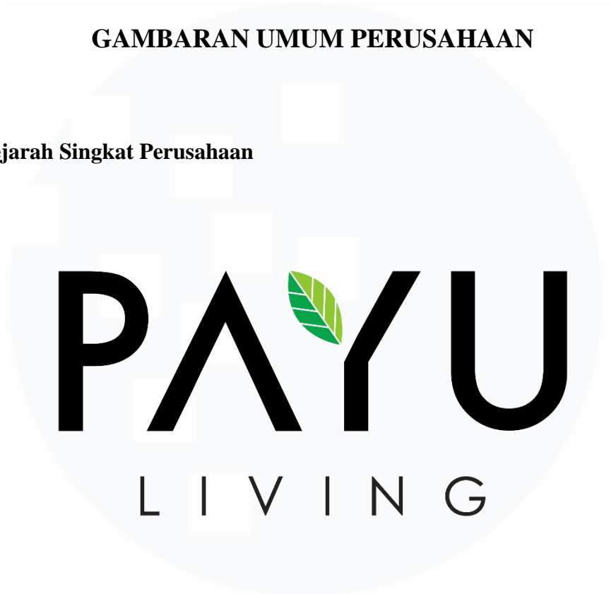
Gambar 2.1. Logo Payu Living.

PAYU LIVING adalah perusahaan yang berfokus pada solusi interior . Berdiri di 2023, sekarang PAYU LIVING memiliki dua divisi, yaitu Accent Wall dan Waldeco Indonesia.