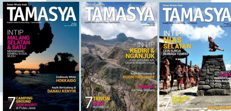
Gambar 2.2 Tampilan Majalah TAMASYA