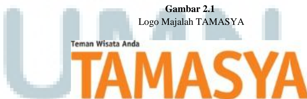
Gambar 2.1 Logo Majalah TAMASYA