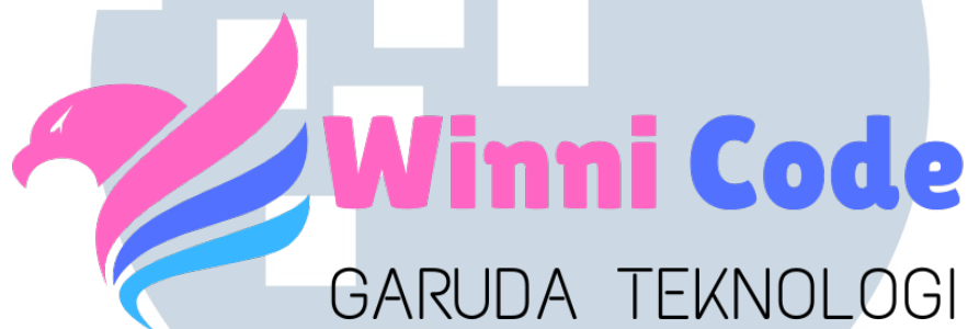
Gambar 2.1. Logo Perusahaan.

Untuk logo perusahaan PT. Winnicode Garuda Teknologi bisa dilihat pada Gambar 2.1.