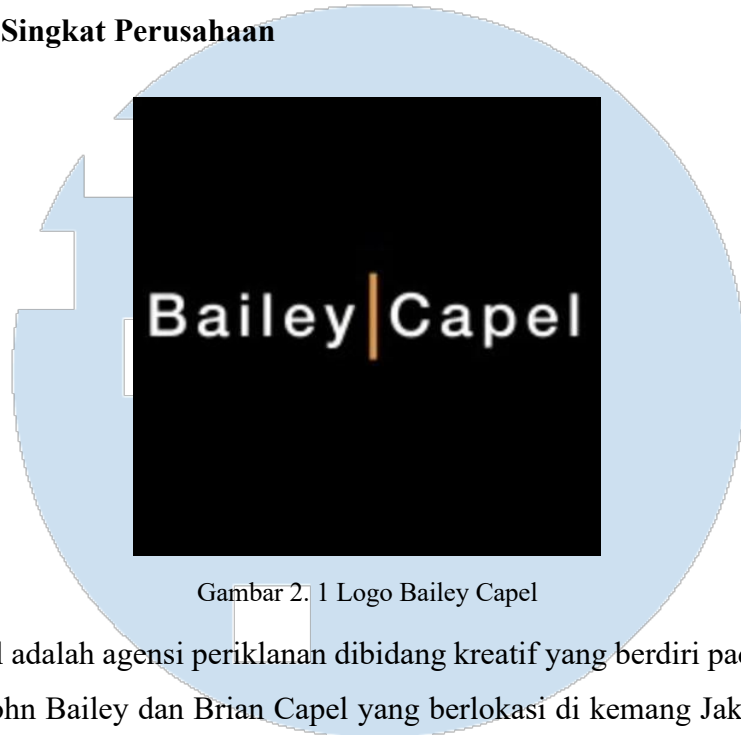
Gambar 2. 1 Logo Bailey Capel

Bailey Capel adalah agensi periklanan dibidang kreatif yang berdiri pada 1 oktober 2021 oleh John Bailey dan Brian Capel yang berlokasi di kemang Jakarta selatan, agency ini merupakan agency periklanan independent yang sebelumnya pernah bergabung dengan DDB Doyle Dane Bernbach Indonesia selama lebih dari 20 tahun, tetapi setelahnya kontrak lisensi DDB di Indonesia telah berakhir sehingga CEO memutuskan untuk membuat agensi baru yang bernama Bailey Capel.