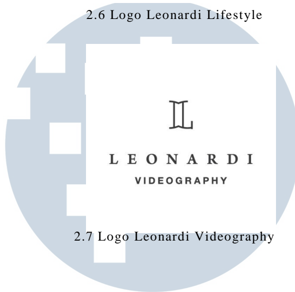
2.7 Logo Leonardi Videography

Pada perubahan terakhir, pada logotype ditambahkan kata “THE” dan menjadi lebih simpel hanya dalam bentuk hitam dan putih, tanpa logo turunan.