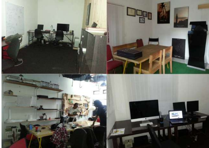
Gambar 2.1 Kantor PT. Sembilan Matahari