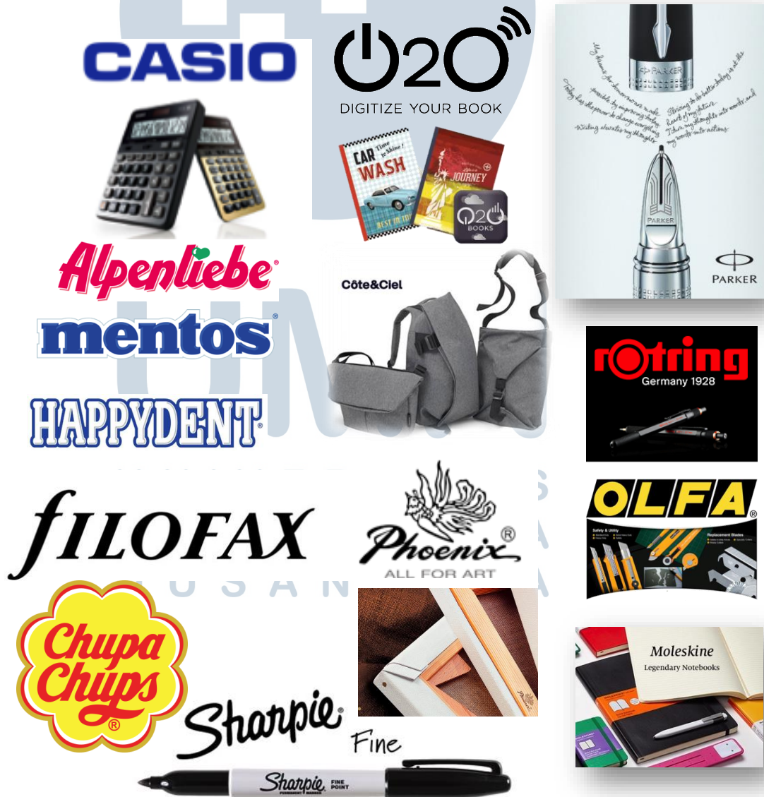
Gambar 2.2. Brand Portfolio

Saat ini PT. Sahabat Utama TraCo telah menjadi salah satu perusahaan distribusi alat tulis terbesar di Indonesia. Beberapa merk yang telah didistribusikan di Indonesia adalah: