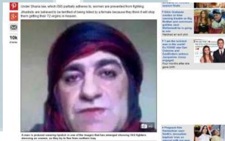
Foto Pasukan ISIS Berdandan Seperti Wanita