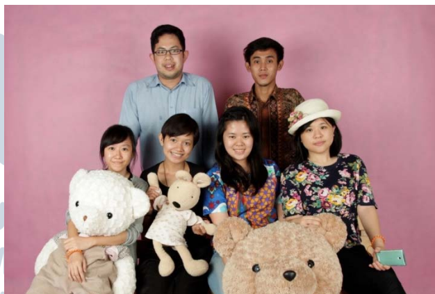
Gambar 2.9 Foto Bersama TIM POP UP

Setelah menyelesaikan periode magang selama dua bulan, Penulis pun bertugas untuk menyelesaikan semua pekerjaan dan kembali ke perkuliahan untuk memberikan laporan. Tim POP UP pun melakukan beberapa pengambilan gambar di studio dengan penulis sebagai tanda telah selesainya periode magang, Berikut adalah foto dari tim POP UP yang selama ini telah membantu dan mendidik penulis.