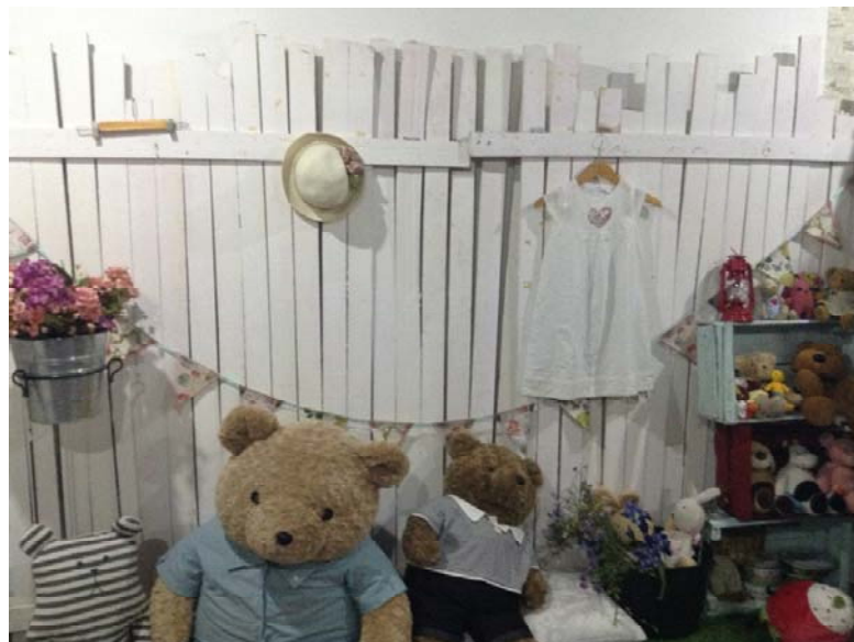
Gambar 2.5 Salah satu dekorasi Studio POP UP