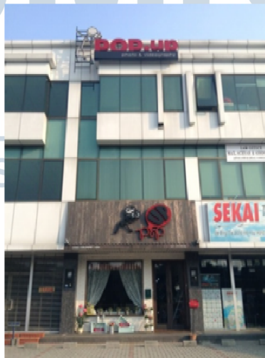
Gambar 2.3 Tampak depan POP UP Studio