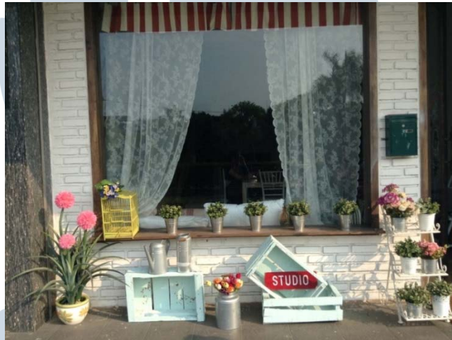
Gambar 2.2 POP UP Studio

Sebagai sebuah studio foto, POP UP Studio juga memperhatikan eksterior dan interior studio. Hal ini selain untuk menarik para konsumen, juga dilakukan untuk menambahkan variasi tempat pengambilan foto dalam studio. Berikut adalah beberapa sudut POP UP Studio .