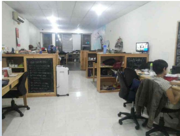
Gambar 2.6 Suasana kantor Studio POP UP lt 3

Pada lt 3, POP UP Studio mempunyai ruangan yang dijadikan sebagai tempat untuk bekerja seluruh pegawai POP UP . Di lt 3 biasanya para pegawai melakukan berbagai aktivitas seperti editing foto, menyelesaikan packaging Album, dsb. Berikut adalah foto dari lt .