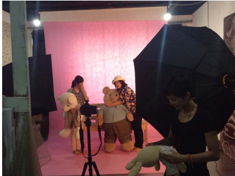
Gambar 2.4 Studio lt 2

Selain dari Keunikan Interior yang dimiliki oleh POP UP , Studio ini juga memiliki studio yang dilengkapi dengan berbagai lighting dan keperluan dalam pemotretan indoor . Dalam Studio ini yang berada di lt 2, POP UP juga memiliki beberapa spot yang bisa dijadikan temoat pemotretan, berikut adalah