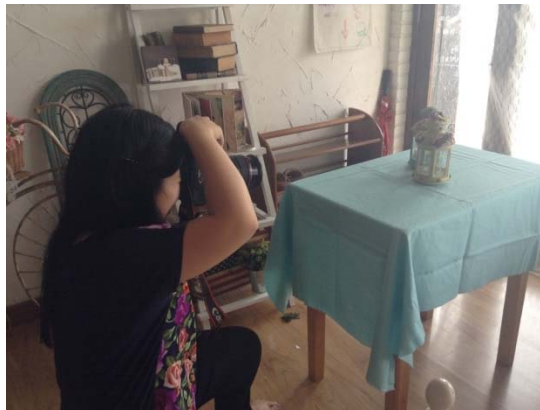
Gambar 2.8 Kegiatan Penulis di Studio POP UP Lt 3

Setelah menyelesaikan periode magang selama dua bulan, Penulis pun bertugas untuk menyelesaikan semua pekerjaan dan kembali ke perkuliahan untuk memberikan laporan. Tim POP UP pun melakukan beberapa pengambilan gambar di studio dengan penulis sebagai tanda telah selesainya periode magang, Berikut adalah foto dari tim POP UP yang selama ini telah membantu dan mendidik penulis.