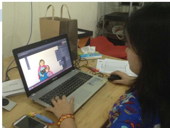
Gambar 2.7 Kegiatan Penulis di Studio POP UP lt 3

Selama praktek kerja magang, penulis dipercayakan beberapa hal seperti editing foto, pembuatan poster, layout album dan fotografer. Kegiatan ini juga dilakukan di lt 3. Selalin itu penulis juga ditugaskan menjadi fotografer baik di studio maupun pemotretan produk untuk kebutuhan web . Berikut adalah beberapa foto yang diambil saat penuli berkerja.