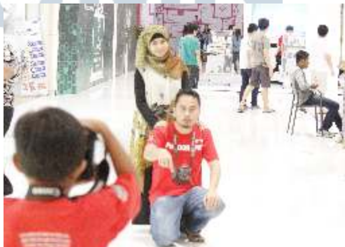
Gambar 3.11 Hasil Foto Penulis yang Terpilih untuk Iklan Artikel