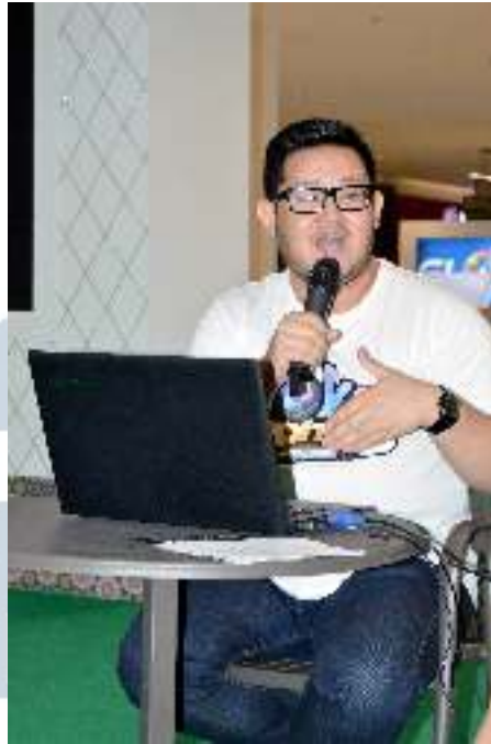
Gambar 3.7 Hasil Foto Penulis yang Terpilih untuk Iklan Artikel