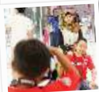
Melatih anak agar hobinya fotografi, instruktur siap membantu.