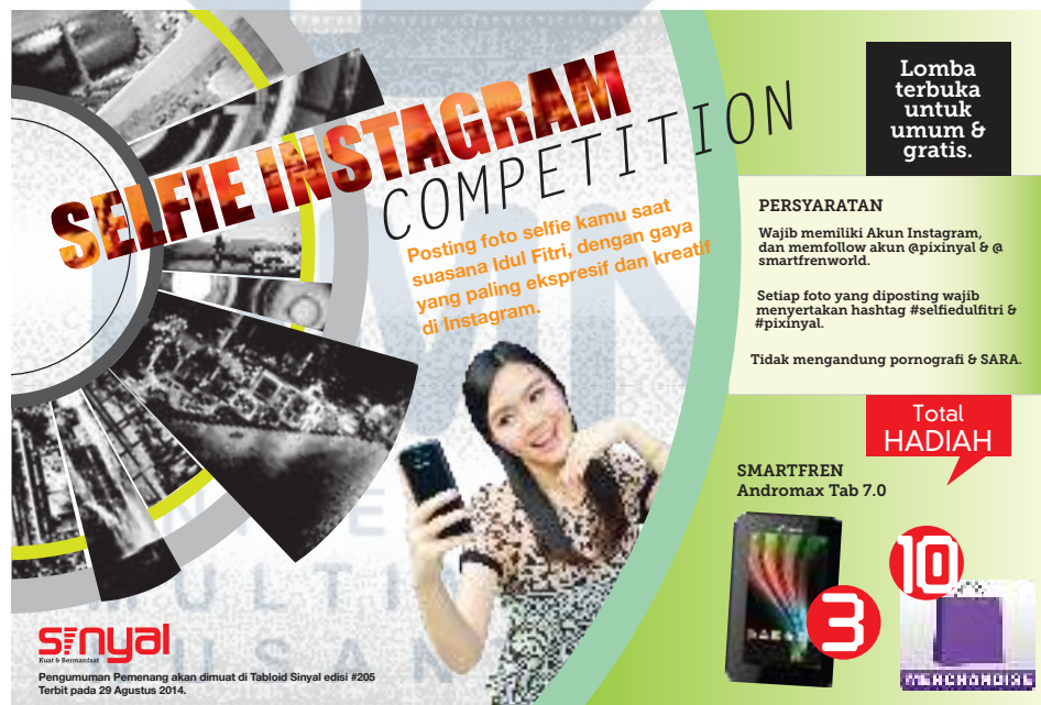
Gambar 3.6 Hasil Desain Poster Lomba Selfie

Setelah hasil print dikembalikan ke penulis, penulis kemudian melihat kesalahan yang sudah ditandai oleh editor visual maupun redaktur, lalu penulis memperbaikinya dan menyimpannya dalam format pdf, dan dikirim ke server redaksi Tabloid Sinyal untuk naik cetak.