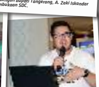
Komunitas Toy Photography Indonesia berbagi tips memotret karakter mainan.