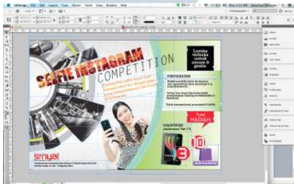
Gambar 3.5 Proses Pembuatan Poster di Adobe InDesign