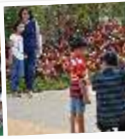
Luangkan waktu untuk mengambil foto keluarga, sekaligus belajar fotografi.