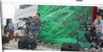
Stage yang disiapkan khusus dengan audio dan stage equipment lengkap.