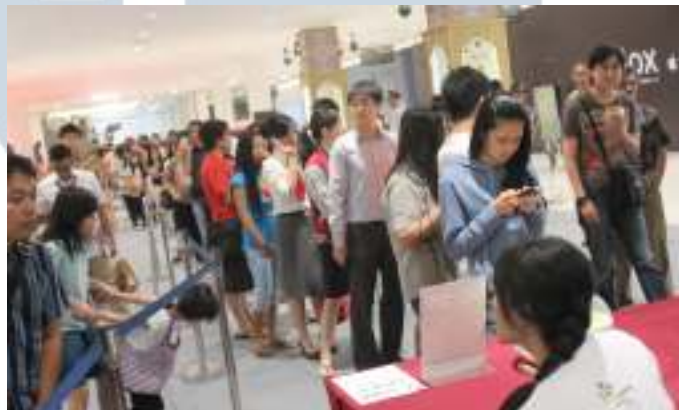
Gambar 3.10 Hasil Foto Penulis yang Terpilih untuk Iklan Artikel