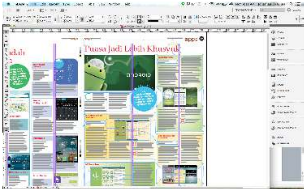
Gambar 3.1 Proses Me-layout Rubrik Apps Puasa