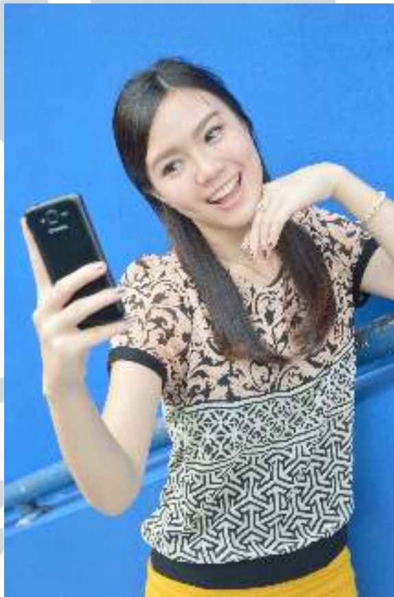
Gambar 3.3 Hasil Foto Model untuk Poster

membantu mendapatkan ide, dan penulis mendapatkan bentuk kamera, ornamen Islam, model yang sedang selfie dan warna hijau lebaran. Dalam mendesain poster ini, penulis tidak mendapatkan data apapun, sehingga gambar dan foto penulis ambil dari instagram Tabloid Sinyal, internet, serta foto sendiri. Penulis membutuhkan model yang sedang selfie , kemudian penulis meminta teman penulis yang merupakan mahasiswa magang dari UMN juga untuk menjadi model, lalu mencari tempat di lingkungan kantor untuk mengambil foto. Setelah semua data yang dibutuhkan telah penulis dapat, penulis dapat segera mengerjakannya.