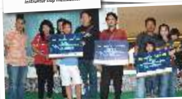
Para pemenang kontes foto family, selain dapat ilmu dapat hadiah uang.