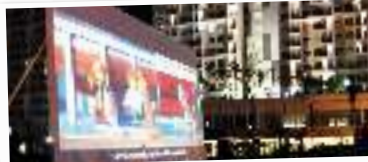
Nonton film Lego Movie di outdoor dengan teknologi audio video terkini.

Selama sebulan, saat Juli sialam, SDC pun menggelar berbagai acara serbadiigital. Semua tenant berpartisipasi. Bahkan tak habis-habisnya door prize dan gelang gadget digencarkan. Sekarang, Anda tak perlu lagi pergi ke Roxy, Mangga Dua, atau pusat gadget lainnya. SDC lebih akomodatif untuk Anda. — ADV