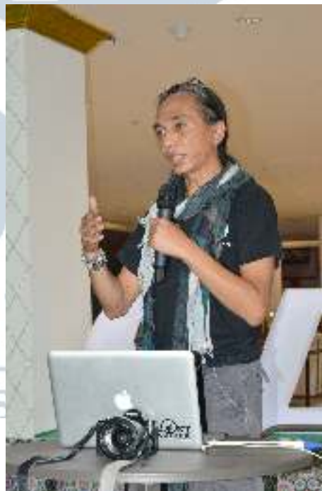
Gambar 3.8 Hasil Foto Penulis yang Terpilih untuk Iklan Artikel