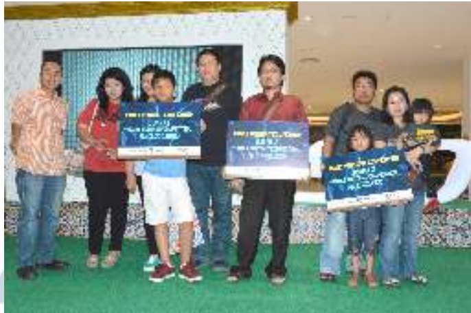
Gambar 3.9 Hasil Foto Penulis yang Terpilih untuk Iklan Artikel