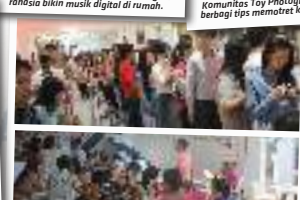
Antre demi memarolahkan diskon besar-besaran yang disediakan oleh tenant.