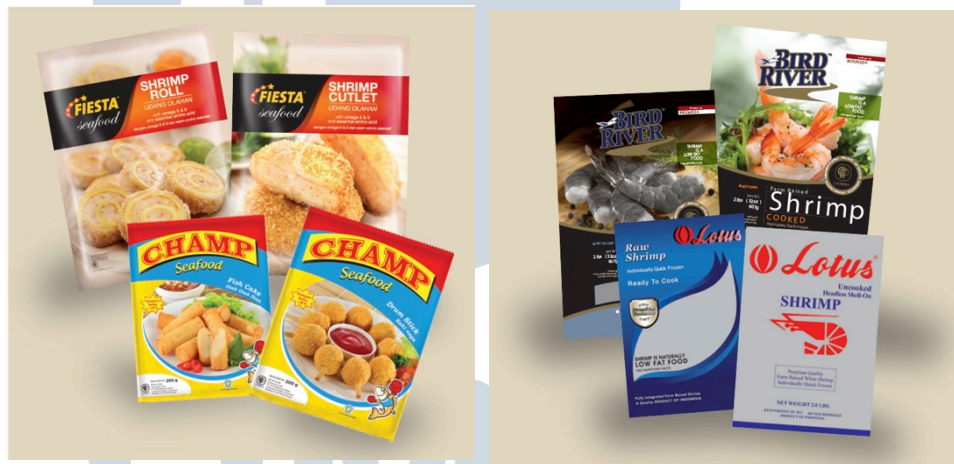
Gambar 2.2. Produk Makanan CP Prima (2013, hlm. 42-43)

CP Prima mengolah udang dan ikan dan menghasilkan serangkaian produk seafood seperti Fiesta Seafood dan Champ Seafood . Fiesta Seafood dan Champ Seafood merupakan produk untuk dalam negeri, sedangkan Bird River dan Lotus merupakan produk untuk ekspor.