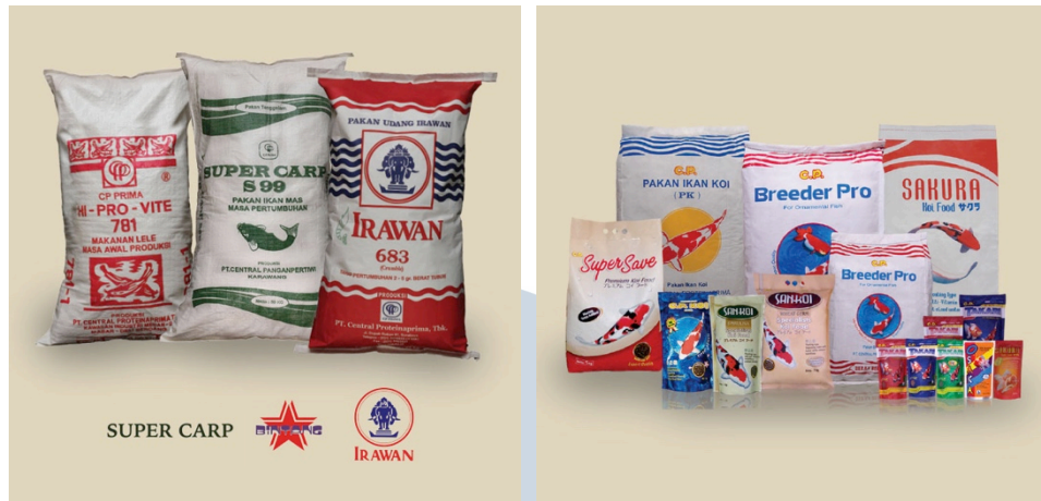
Gambar 2.3. Beberapa Produk Pakan CP Prima (2013, hlm. 42-43)