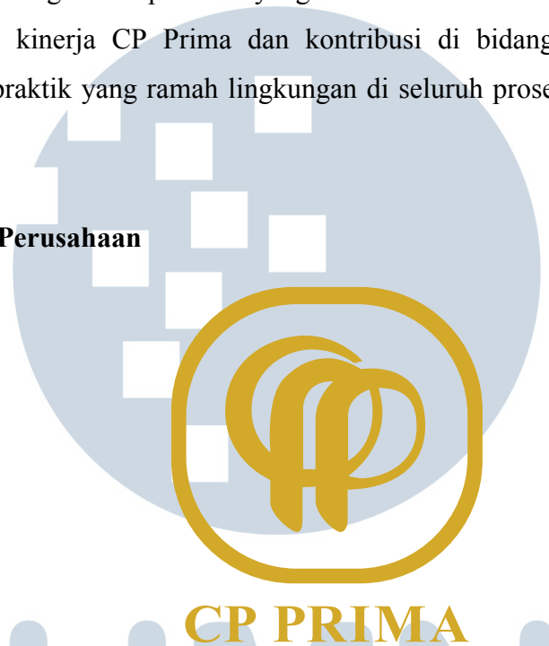
Gambar 2.1. Logo Perusahaan CP Prima (2013, hlm. 42-43)

Master logo perusahaan CP Prima terbagi menjadi 2 elemen, yaitu logotype (berupa tipografi yang bertuliskan nama perusahaan, CP PRIMA) dan logogram (berupa objek atau lambang perusahaan). Logo CP Prima menggunakan warna emas/ gold . Untuk makna atau kesan dari logo CP Prima sendiri tidak ada. Dan tidak ada yang mengetahui secara pasti konsep dari logo.