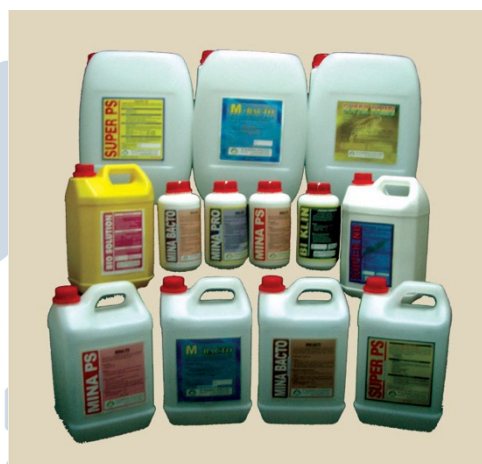
Gambar 2.4. Beberapa Produk Probiotik untuk Udang dan Ikan (2013, hlm. 42-43)

CP Prima juga memproduksi probiotik untuk udang dan ikan yang kegunaannya untuk meningkatkan dan memelihara kualitas lingkungan pada kolam alami.