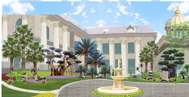
Gambar 2.5 Desain Taman Tampak Depan Rumah Rudi Halim

Berikut beberapa contoh hasil jasa desain dan perencanaan landscape PT Cendrawasih farin :