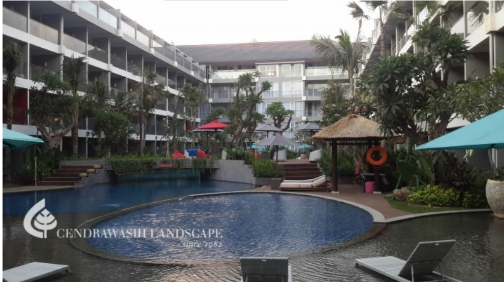
2.13 Ramada Encore Hotel – Bali