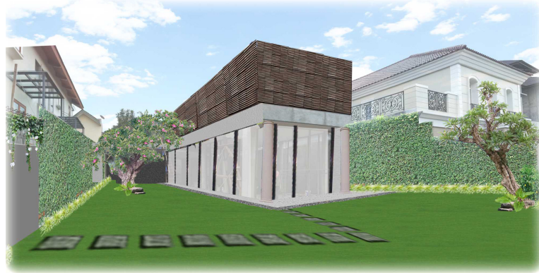
Gambar 2.6 Desain Taman Samping Rumah Dedi Lippo karawaci