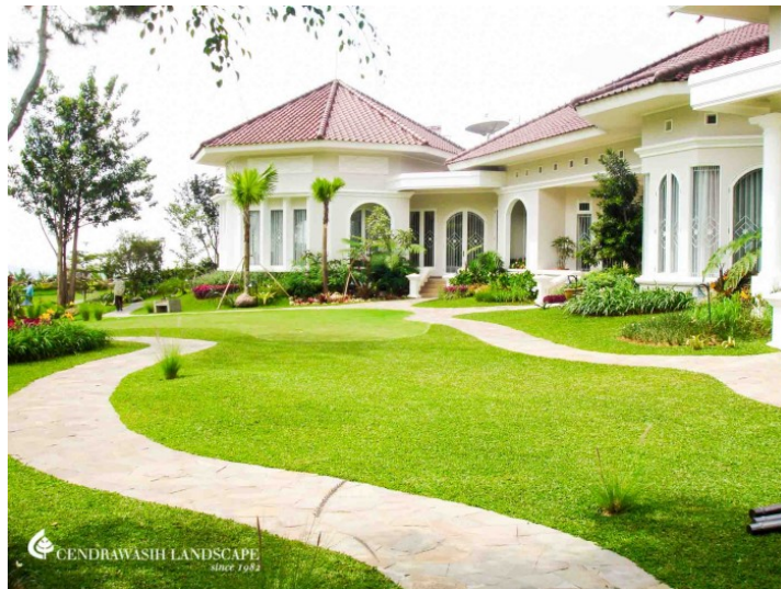
2.15 Private Villa - Colibah puncak