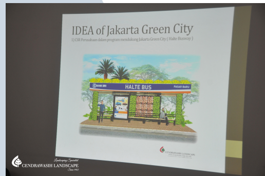
Gambar 2.4 Ide Desain Landscape