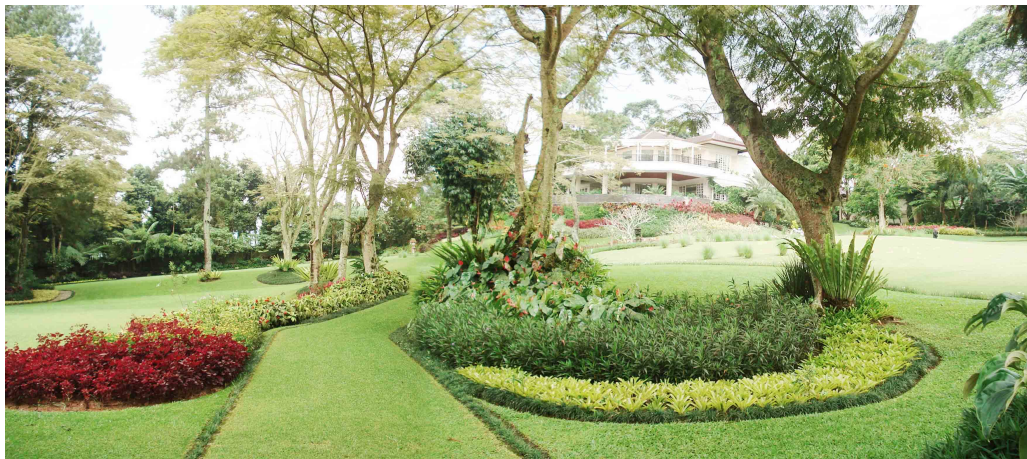
Gambar 2.7 Villa Abrian – Citeko Puncak

PT Cendrawasih Farin membuat taman tropis yang dihiasi dengan menggunakan warna-warna eksotis seperti merah, oranye, hijau dan merah muda. Selain itu terdapat beberapa bunga sehingga dapat menarik perhatian.