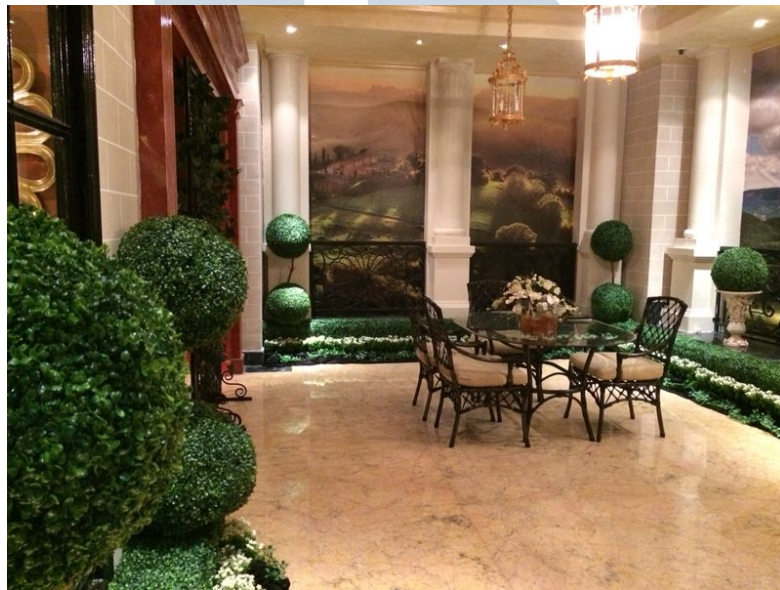
Gambar 2.8 Da Vinci - Jakarta

Taman kering bisa ditempatkan didalam atau diluar ruangan dengan intensitas cahaya yang minim. Taman kering sangat cocok untuk penghuni yang kurang telaten untuk merawat tanaman namun tetap menghadirkan elemen hijau dirumahnya.