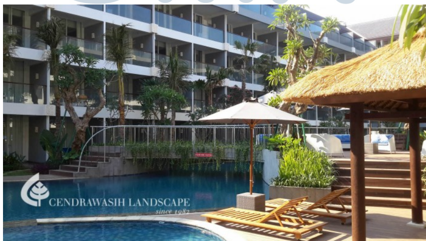
Gambar 2.10 Ramada Encore Hotel – Bali

Menambah elemen hijau, menjadikan kolam renang terkesan lebih segar dan alami. Dalam membuat proyek ini, Selain menambah tanaman, PT Cendrawasih Farin membuat gazebo disekitar kolam renang sebagai tempat peristirahatan penghuni.