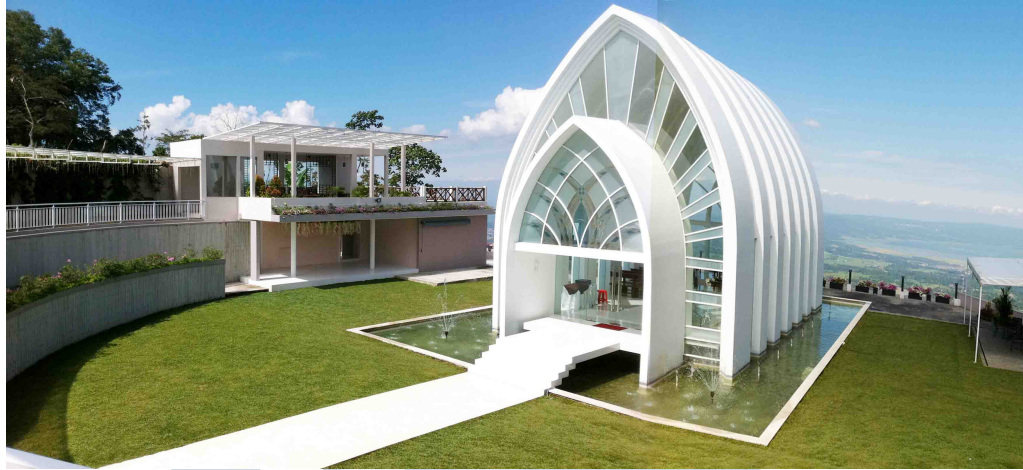
2.12 Susan Spa Bandungan – Jawa Tengah