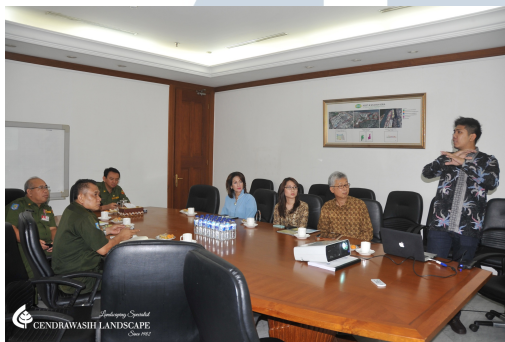
Gambar 2.3 Konsultan Desain Landscape

PT Cendrawasih Farin melayani jasa konsultasi desain dan memberikan solusi yang tepat dan cepat. Berikut salah satu foto ketika Bapak Hanny Tjandra dan Bapak Indra Cahyawanto memberikan konsultasi desain landscape kepada Bapak Ahok dalam rangka pembangunan proyek Jakarta Green City .