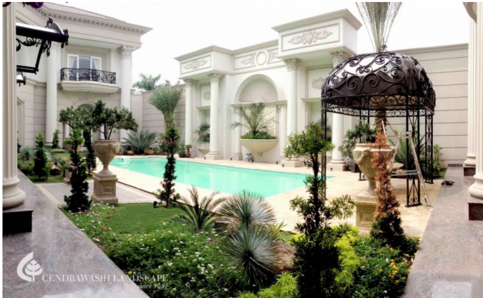
Gambar 2.11 Taman Tirta Golf BSD