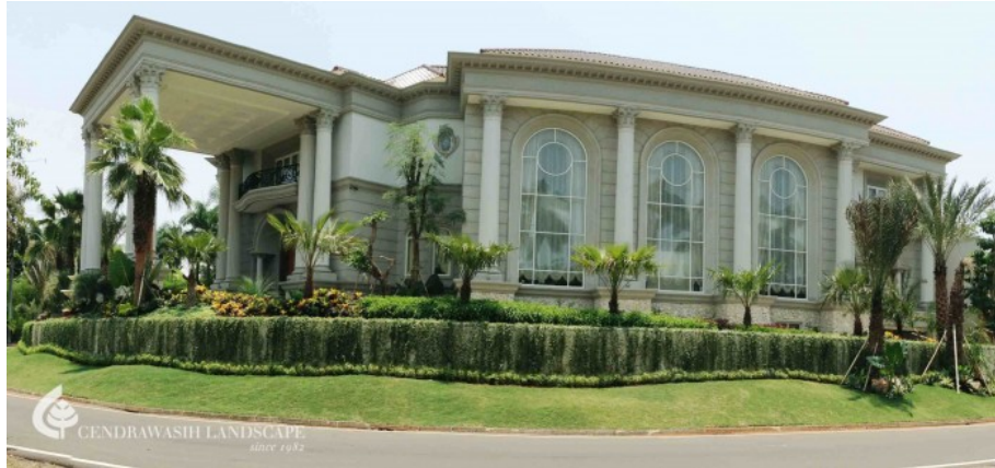
2.16 Private home - Taman Tirta Golf BSD