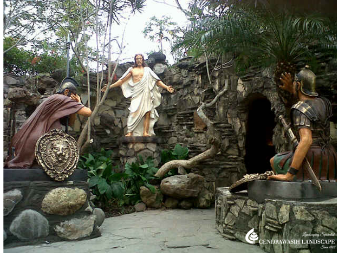
2.14 Gua Maria Kerep Ambarawa