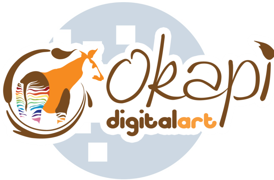
Gambar 2.1. Logo Okapi Digital Art

Logo Okapi Digital Art dibagi menjadi dua komponen, yaitu gambar dan tipografi. Untuk gambarnya, Okapi Digital Art mengadopsi langsung dari binatang khas negara kongo, yaitu Okapi sendiri. Okapi adalah binatang yang memiliki ciri khas berupa loreng seperti zebra, namun loreng tersebut hanya terdapat pada kaki dan menjalar sampai bagian belakang tubuhnya. Oleh karena itu, gambar pada logo Okapi Digital Art menampilkan sisi bagian belakang dari hewan Okapi, di mana loreng tersebut lebih menyolok. Kemudian sapuan kuas yang mengelilingi gambar Okapi, membantuk sebuah huruf “O”, yang merupakan akronim atau huruf pertama dari Okapi.