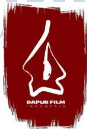
Gambar 5.1 Logo Perusahaan

Sejak berdiri, PT DapurFilm Production telah mengalami beberapa kali pergantian logo perusahaan. Hingga saat ini Dapur Film telah memiliki 4 logo. Logo yang saat ini digunakan adalah sebuah logo dengan tulisan ‘Dapur Film Indonesia’ dan memiliki background merah gelap.