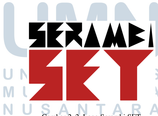
Gambar 2. 2. Logo Serambi SET