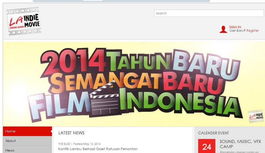
Gambar 2.5. Website LA Lights Indie Movie ( http://www.laindiemovie.com , 2013)