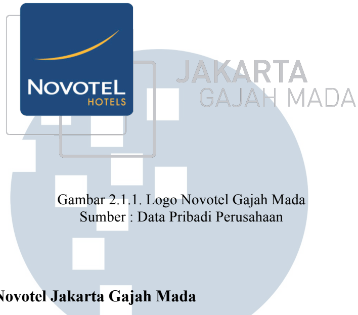
Gambar 2.1.1. Logo Novotel Gajah Mada Sumber : Data Pribadi Perusahaan