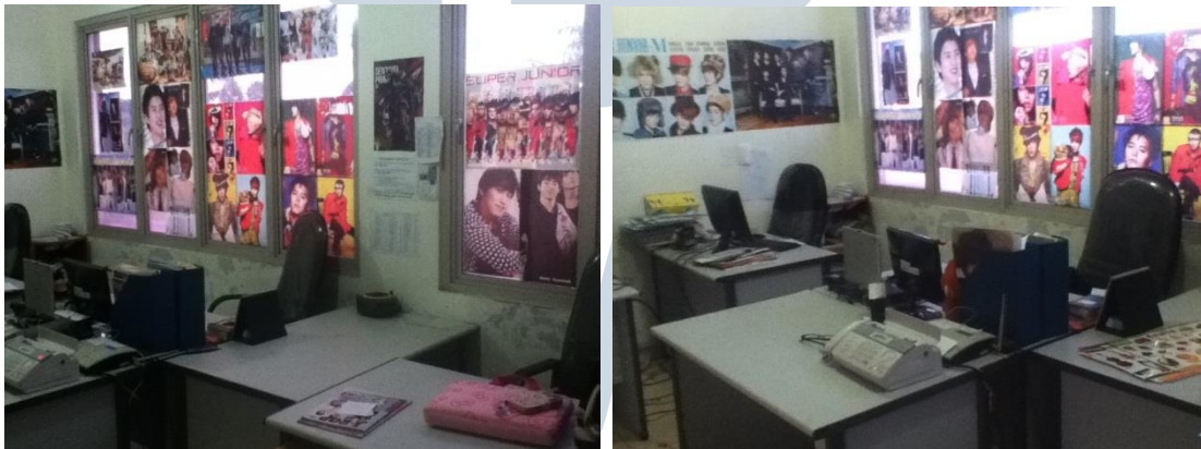
Gambar 2.3 Suasana tempat kerja di CV Media Center