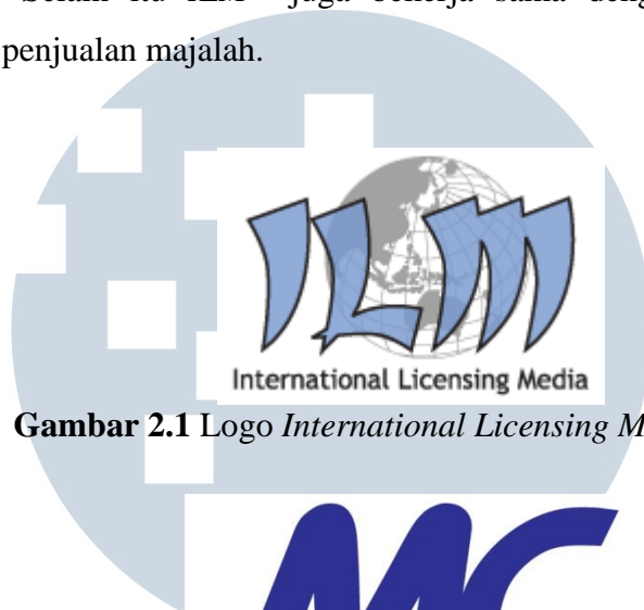
Gambar 2.1 Logo International Licensing Media (ILM)

Untuk menjangkau seluruh para pembaca, ILM menerapkan berbagai strategi penjualan. Sebagian produk ILM dititipkan di toko-toko buku, seperti Gramedia dan juga lapak- lapak yang menjual Koran dan majalah. Bagian pemasaran ILM juga melayani pengiriman secara langsung bagi yang berlangganan. Selain itu ILM juga bekerja sama dengan Indomaret untuk distribusi dan penjualan majalah.