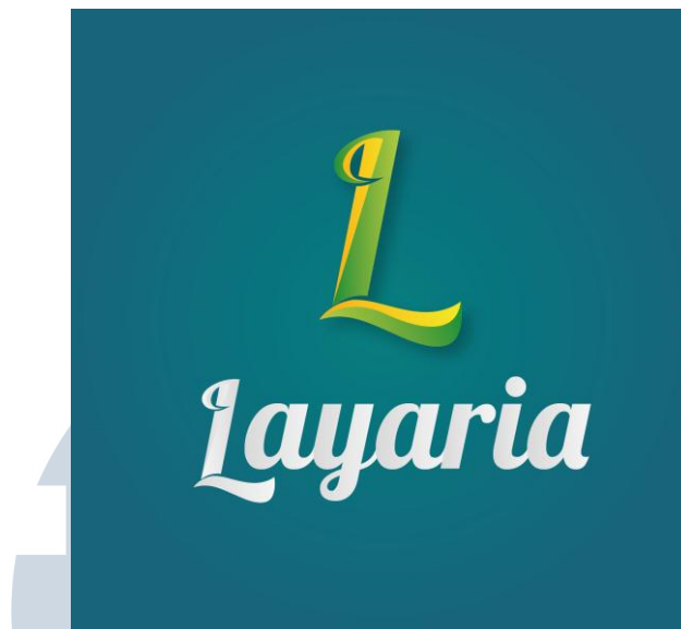
Gambar 2.1. Logo Perusahaan LayariaTV

Warna hijau melambangkan lingkungan dan perkembangan baru di bidang video streaming . Warna kuning pada logo perusahaan melambangkan optimisme dan semangat jiwa muda dan juga mempunyai arti menambah keceriaan dan kehangatan. Warna biru merupakan lambang dari seorang pria dan bersifat tenang, mempunyai arti produktif dan menciptakan rasa percaya, yakin dan aman.