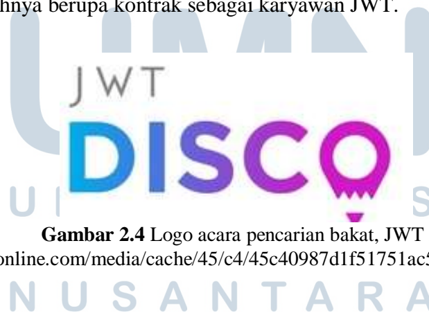
Gambar 2.4 Logo acara pencarian bakat, JWT Disco ( http://lbbonline.com/media/cache/45/c4/45c40987d1f51751ac574a115b6bb408.jpg )

Salah satu bentuk kerja sama yang telah dijalankan oleh XM JWT yaitu dalam ajang tahunan pencarian bakat tahunan yang diselenggarakan oleh JWT bernama JWT Disco. Pada ajang ini akan dicari bibit kreatif dengan syarat 18 - 24 tahun yang akan ditantang dengan creative brief yang dirilis sekali dalam setahun, dengan hadiahnya berupa kontrak sebagai karyawan JWT.