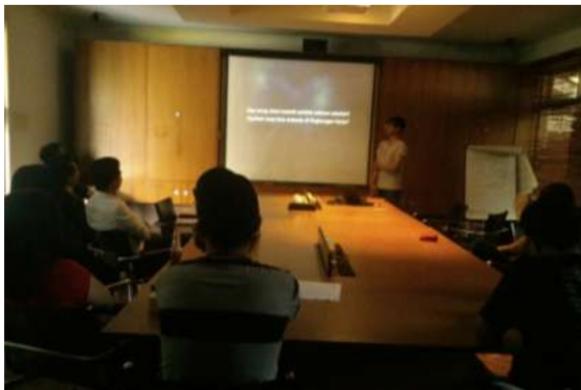
Gambar 2.7 Suasana Scrum Session (Dokumentasi pribadi)

( https://twitter.com/JWTJakarta/status/461418084058669056/photo/1/large )