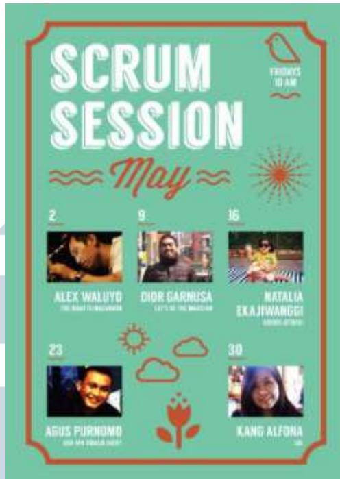
Gambar 2.6 Poster Scrum Session

( https://twitter.com/JWTJakarta/status/461418084058669056/photo/1/large )