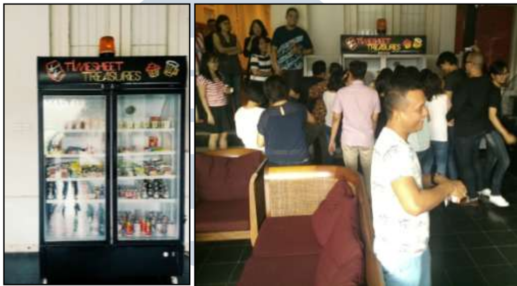
Gambar 2.8 Suasana pada saat alarm Timesheet Treassure berbunyi (Dokumentasi pribadi)

Sesi ini selalu diadakan sebelum karyawan JWT Jakarta memulai pekerjaan, setiap karyawan aktif akan mendapatkan giliran berbicara tiap minggunya. Pada akhir bulan pembicara Scrum Session yang akan tampil diberitahukan secara luas ke karyawan JWT melalui e-mail ataupun poster yang ditempel didepan ruang Scrum yaitu di ruang meeting.