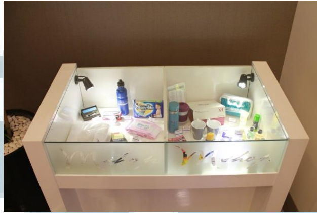
Gambar 2.7 M-Shop