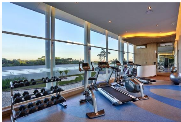
Gambar 2.4 Fitness Center