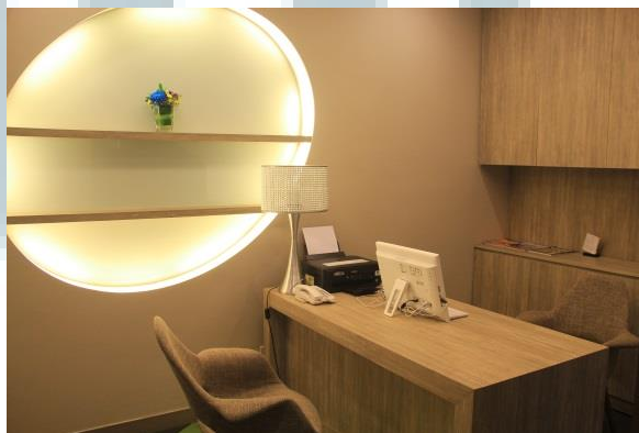
Gambar 2.6 Business Center