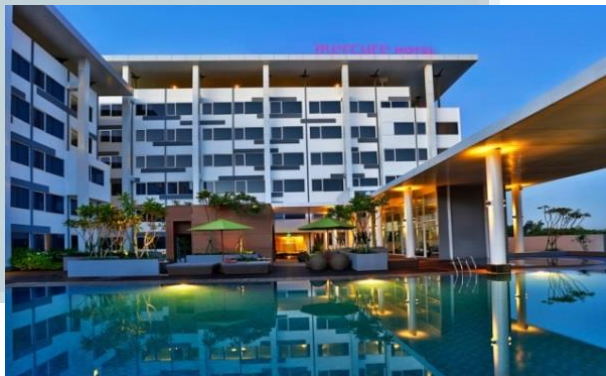
Gambar 2.3 Swimming Pool