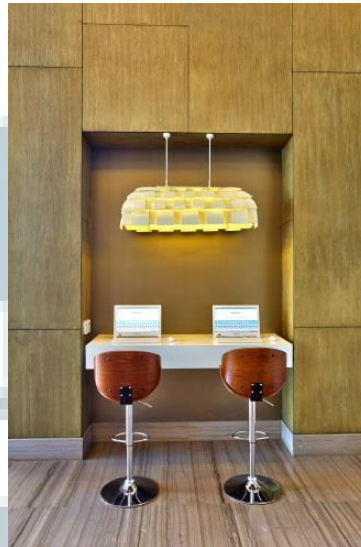
Gambar 2.5 Web Corner