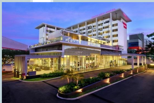
Gambar 2.1 Hotel Mercure Serpong Alam Sutera