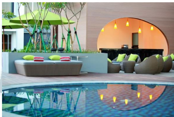
Gambar 2.10 Maniz Pooldeck