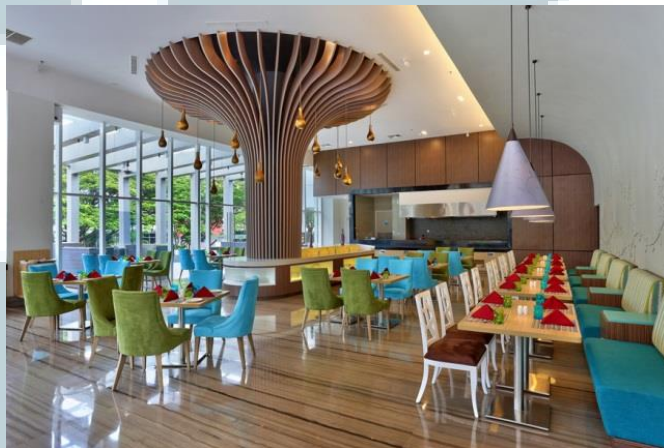
Gambar 2.8 Mint & Pepper Restaurant