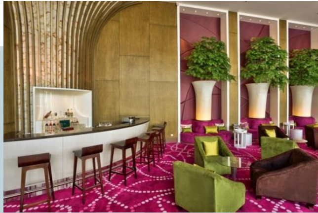
Gambar 2.9 Mocca Lounge Bar