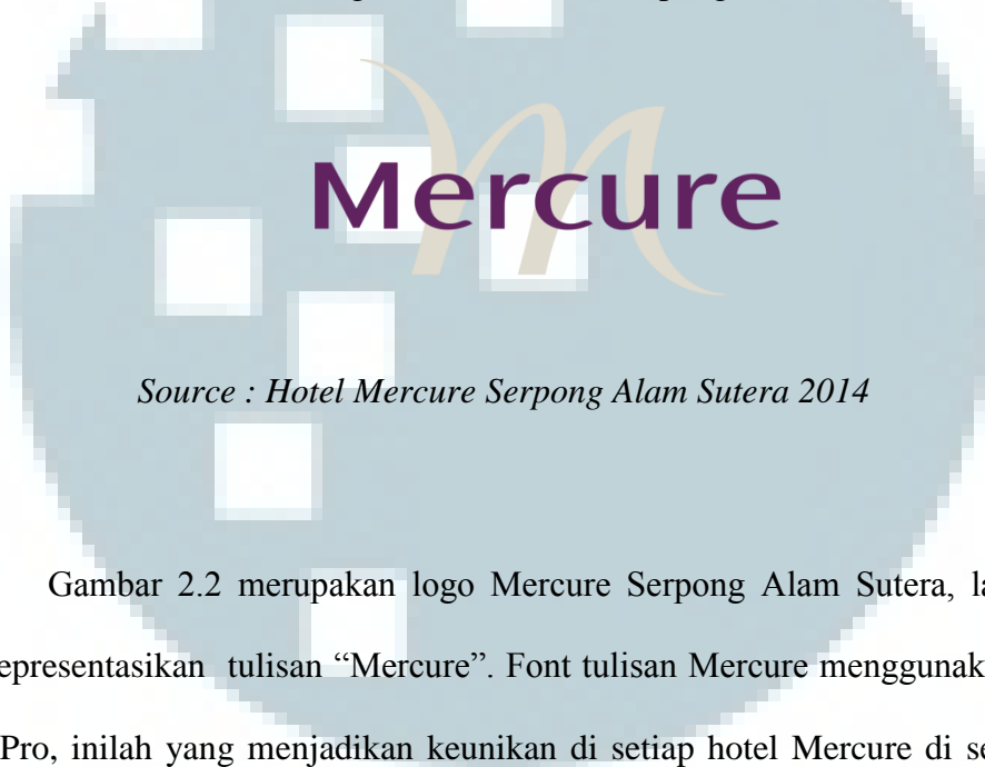
Gambar 2.2 Logo Hotel Mercure Serpong Alam Sutera