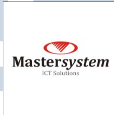
Gambar 2.1. PT Mastersystem Infotama

PT Mastersystem Infotama didirikan pada bulan Juli 1994. PT Mastersystem Infotama telah berkembang menjadi salah satu penyedia infrastruktur Information and Communication of Technology (ICT) terkemuka. Berkantor pusat di Jakarta, PT Mastersystem Infotama memiliki kantor cabang di Surabaya, Jawa Timur. PT Mastersytem Infotama juga memiliki anak perusahaan, salah satunya adalah PT Graha Karya Informasi [5].